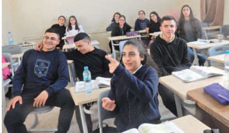
La educación es una prioridad para el Patriarcado latino, apoyado en su labor por la Orden del Santo Sepulcro.

Los «proyectos», que a partir de ahora forman parte de las expectativas de desarrollo de las instituciones de Tierra Santa, son una nueva fuente de preocupación para las parroquias y las escuelas. La incertidumbre que engloba a estos proyectos es una gran fuente de inquietud. Se necesita poner en marcha un proceso más transparente y eficaz de financiación de proyectos en el marco del conjunto de actividades del Patriarcado. Algunos puntos se tratarán con más detalle para permitir la realización de los proyectos.