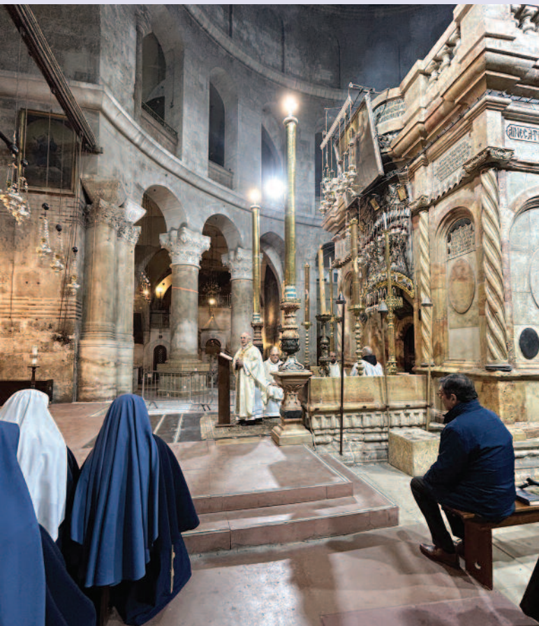
Misa celebrada por el Gran Maestre en el Santo Sepulcro.