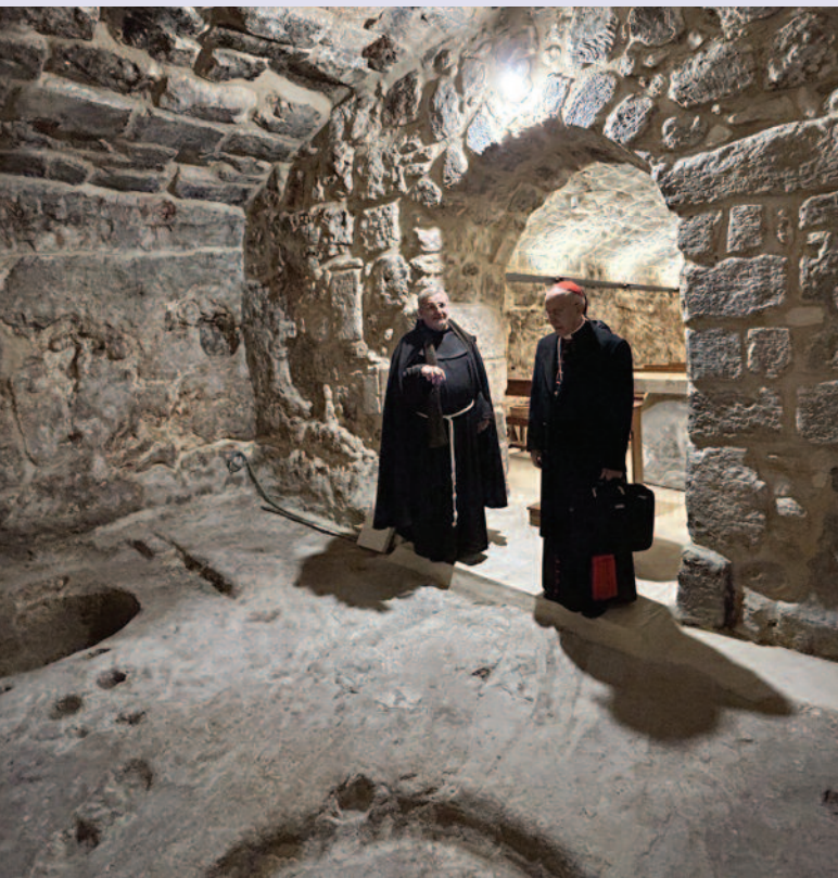
Visita a las «entrañas» de la basílica del Santo Sepulcro con un hermano franciscano de la Custodia.

del pavimento de este lugar santo, tan querido por todos los cristianos. El Gran Maestre y el Gobernador General conversaron detenidamente con estos religiosos, que durante siglos han preservado la presencia católica en el Santo Sepulcro en comunión con el clero griego ortodoxo y armenio.