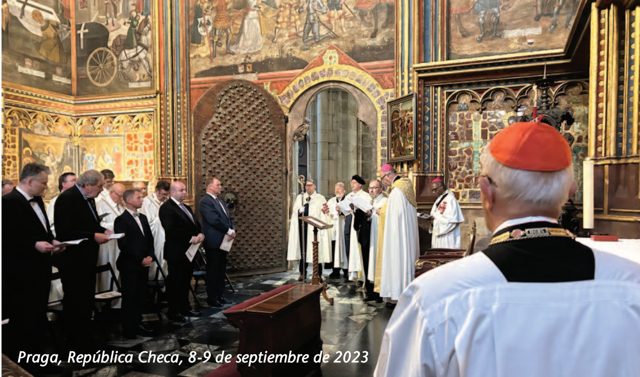
Praga, República Checa, 8-9 de septiembre de 2023