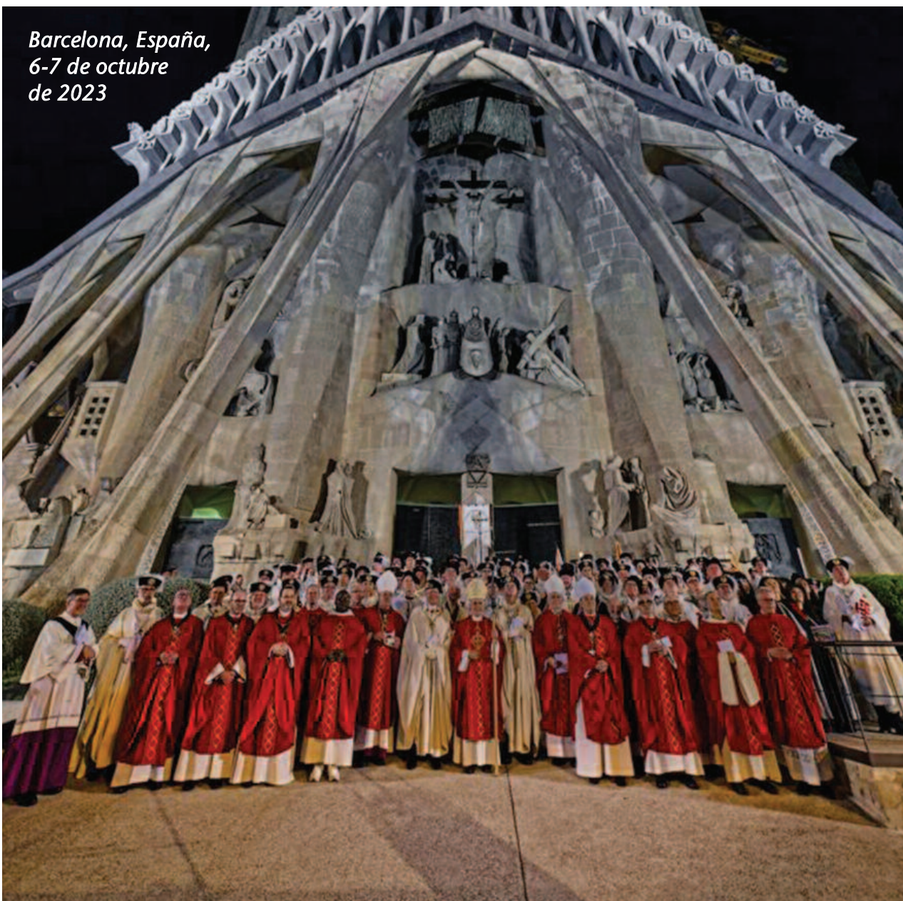
Barcelona, España, 6-7 de octubre de 2023