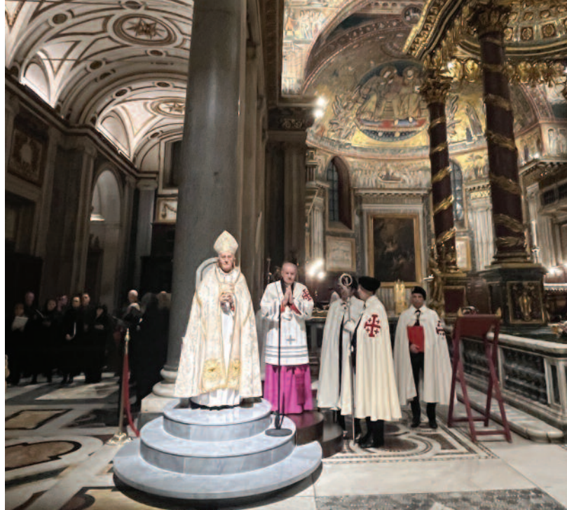
Roma, Italia, 15-16 de diciembre de 2023