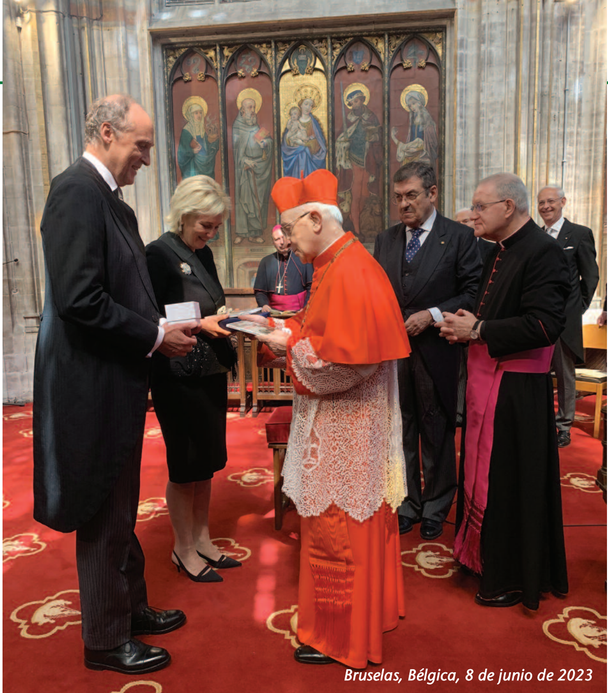
Bruselas, Bélgica, 8 de junio de 2023