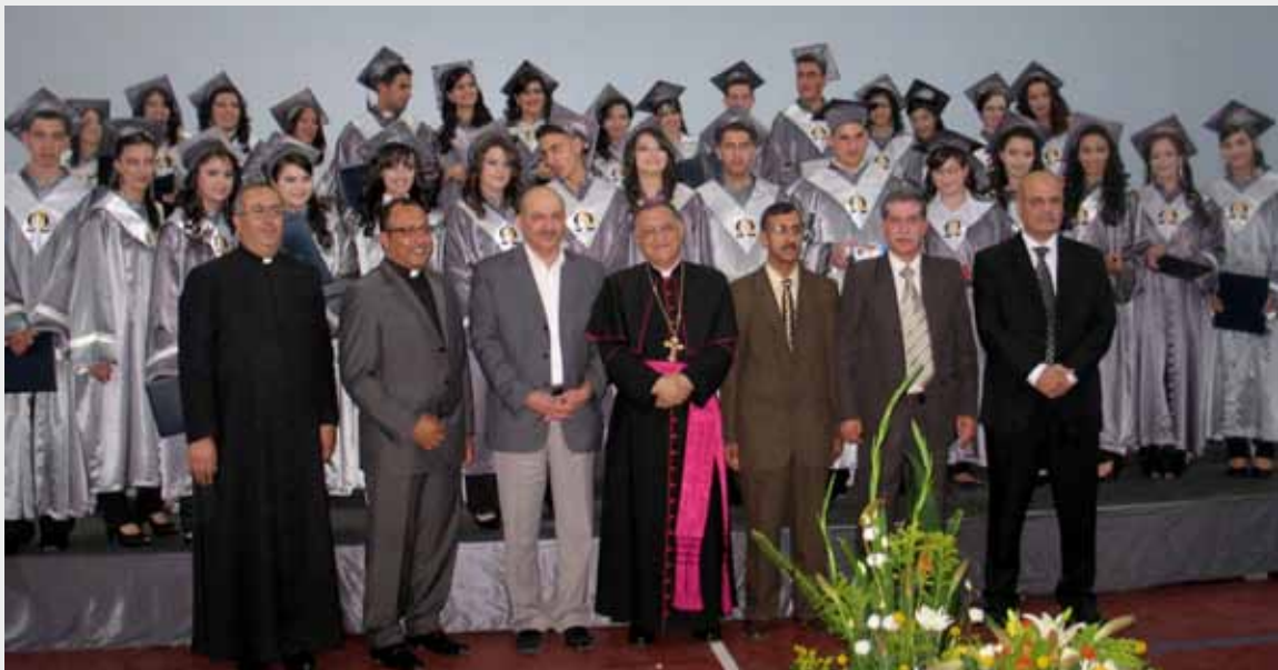
Photographie en haut : Fête du baccalauréat à Beit Jala