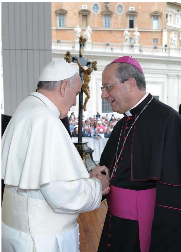
Mons. Bruno Forte con el Papa Francisco

a través de las elecciones humildes y valientes de fidelidad a Dios y al pueblo.