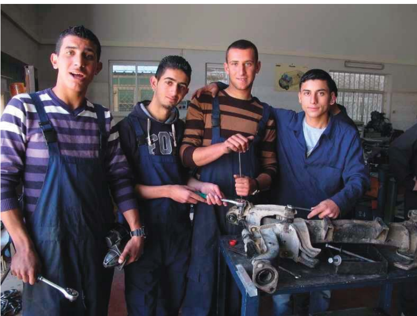
Algunos jóvenes del Centro de Formación Profesional de los salesianos de Belén durante los talleres

Otros agradecimientos nos llegan de los Salesianos de Belén quienes, desde hace muchos años, realizan diferentes actividades de formación profesional e inserción en el mundo del trabajo para los jóvenes, de manera que puedan encontrar un trabajo, sin tener que emigrar. Además de las actividades del centro de jóvenes y del oratorio, los Salesianos administran una escuela técnica frecuentada por unos 160 estudiantes, un centro de formación profesional con el mismo número de inscritos y una escuela de arte.