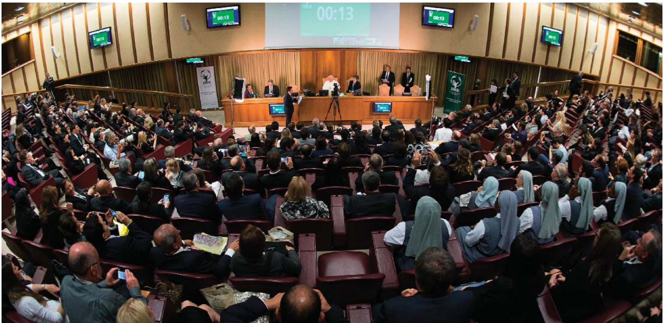
El Papa unido por videoconferencia con alumnos de diferentes escuelas en el mundo, en directo desde la sala del Sínodo

escuelas para el encuentro" había organizado una videoconferencia en directo desde la sala del Sínodo, cerca de la Casa Santa Marta, en la que participaron particularmente niños de Israel. "Tended puentes de paz, jugad en equipo y haced un futuro mejor", les dijo Francisco. En relación con ese congreso de la red Scholas también ha tenido lugar, en ese mismo periodo, el partido interreligioso por la paz con la presencia del futbolista argentino Diego Maradona, que ha declarado querer volver a la práctica de la fe católica, conmovido por el testimonio de vida evangélica del Papa Francisco. También nos queda a nosotros, a todos los niveles de la Orden del Santo Sepulcro, construir puentes en vez de construir muros. "La esperanza ve lo que no es todavía, pero que será. Ama lo que aún no es y lo que será" (Charles Péguy).