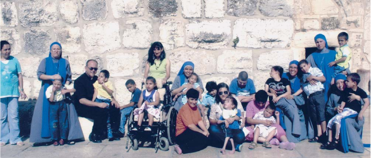
Las religiosas del Verbo Encarnado con los niños que son acogidos en el "Hogar Niño Dios"

Recibimos con alegría los agradecimientos para los proyectos que la Orden apoya en Belén y nos alegra poder compartirlos. También adjuntamos algunas fotos de jóvenes que benefician de nuestra ayuda.