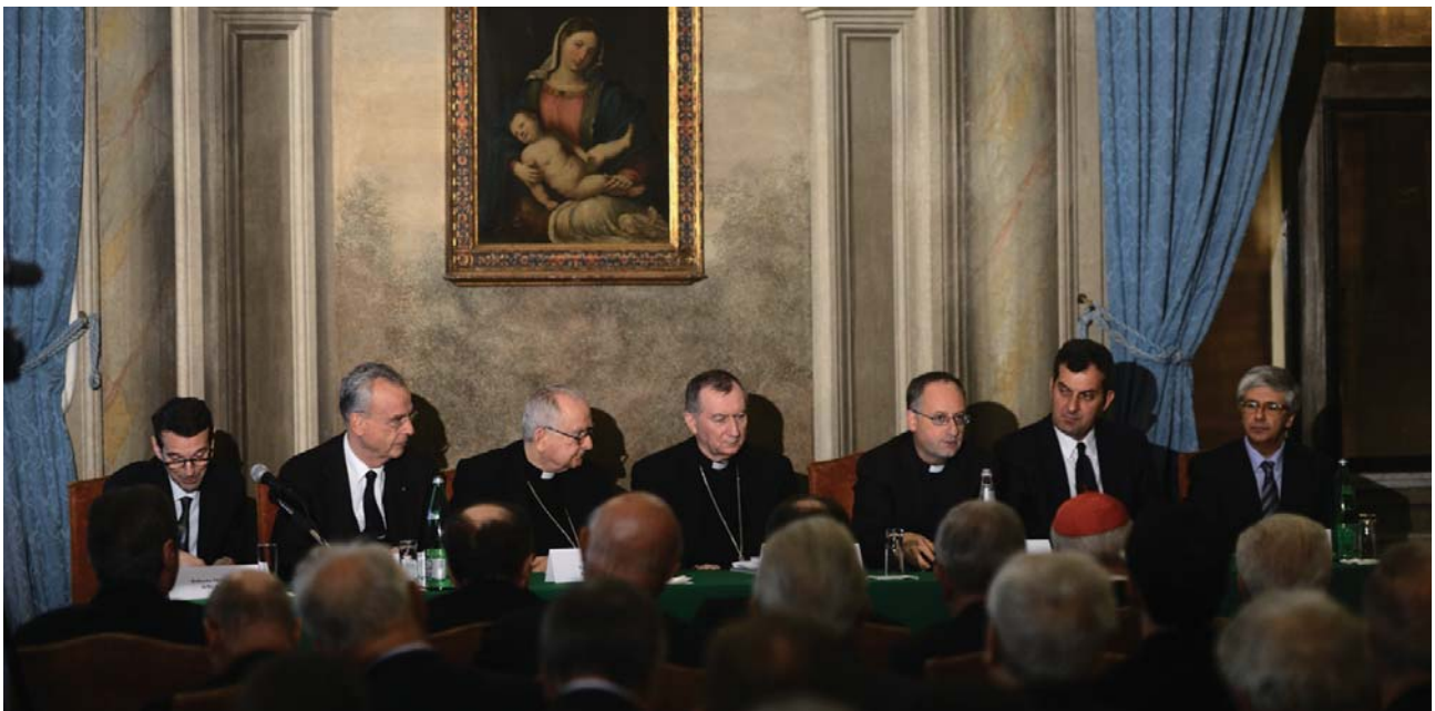
Los conferenciantes del tema Comunicación digital y Diplomacia, el pasado 5 de diciembre, en la sede del Gran Magisterio de la Orden del Santo Sepulcro.