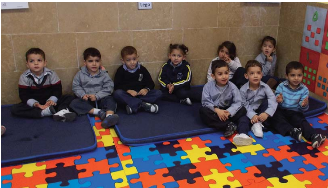
Una escuela de preescolar del Patriarcado ayudada por la Orden.

por ejemplo la acción llevada por el rey de Jordania para acoger a los cristianos perseguidos de Siria e Iraq. Reiteró por otro lado delante del Gran Magisterio su llamada a la compra de casas y edificios en Belén dónde la presencia musulmana se intensifica, y en Jerusalén dónde ocurre lo mismo con la presencia judía, esto es para permitir la vivienda a largo plazo de familias cristianas en estas dos ciudades tan esenciales para la Iglesia.