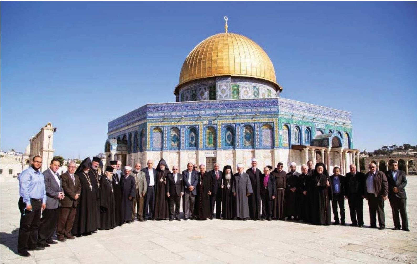
La delegación de los responsables de las Iglesias cristianas en Jerusalén y de los jefes religiosos musulmanes de la Ciudad Santa, el 10 de noviembre, en la Explanada de las Mezquitas.

constante y vigilante protección para que su acceso razonable sea mantenido como lo ha previsto el Statu Quo para las tres religiones monoteístas”.