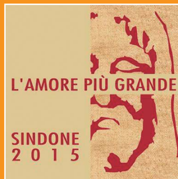
El logotipo oficial de la Ostensión de la Sábana Santa para 2015 en Turín.

dos por San Juan Bosco y los salesianos. El servicio pastoral diocesano de la salud pondrá a su disposición y la de sus acompañantes, dos estructuras de acogida. Gracias a la colaboración de más de 3500 voluntarios, se celebrarán momentos de oración, en locales cercanos a la zona de la Catedral. La visita será gratuita aunque la reserva es obligatoria para una mejor coordinación del flujo de peregrinos y deberá realizarse en el sitio de internet: www.sindone.org