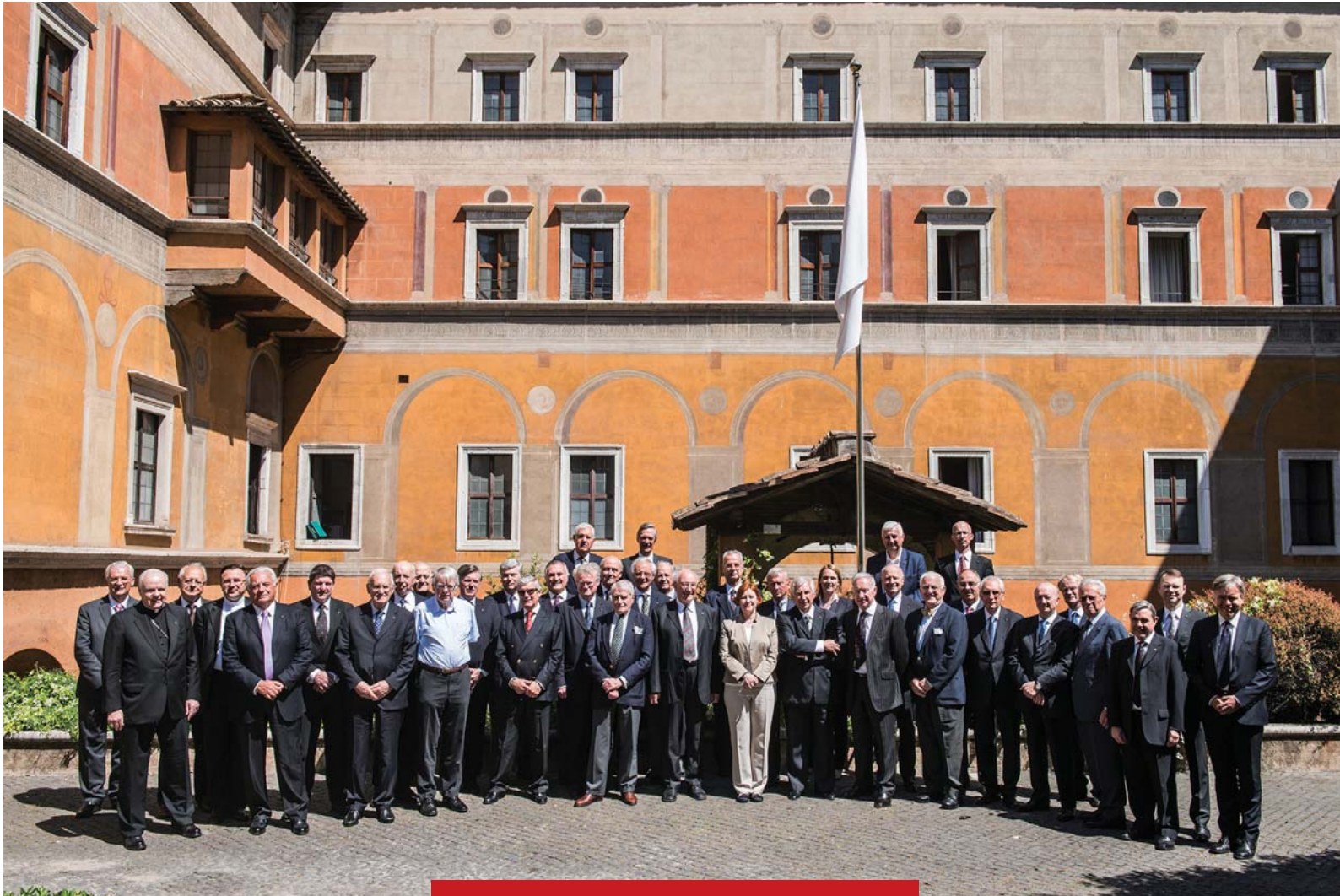
Les Lieutenants européens réunis au Palazzo Della Rovere, en mai 2015.

trouvé refuge dans les paroisses du Patriarcat latin de Jérusalem, en particulier dans le Royaume hachémite de Jordanie.