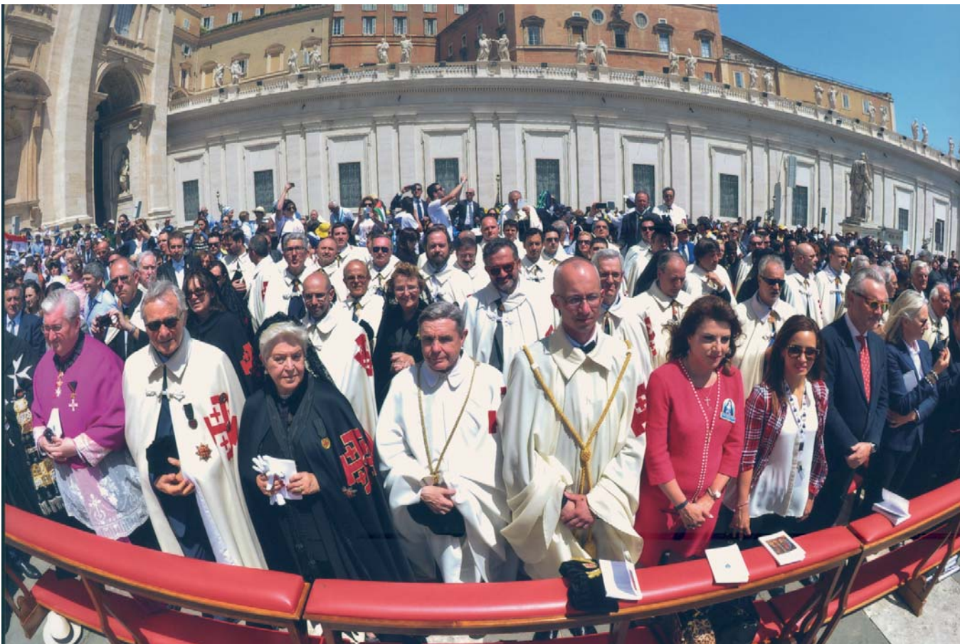
Chevaliers et Dames de l'Ordre du Saint-Sépulcre sur la place Saint-Pierre lors de la canonisation de deux saintes palestiniennes.

l'amour de Dieu dans l'apostolat, en devenant témoin de douceur et d'unité. Elle nous offre un exemple clair de l'importance de nous rendre responsables les uns des autres, de vivre l'un au service de l'autre ».