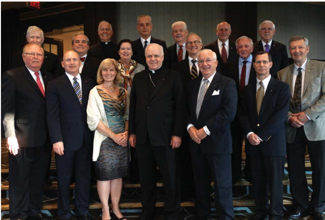
Le Grand Maître de l'Ordre du Saint-Sépulcre entouré des Lieutenants d'Amérique du Nord, à Québec, en juin 2015 (un compte-rendu de cette rencontre vous sera proposé dans notre prochaine Newsletter).

Nous en remercions le Seigneur, ainsi que chacun de nos généreux membres.