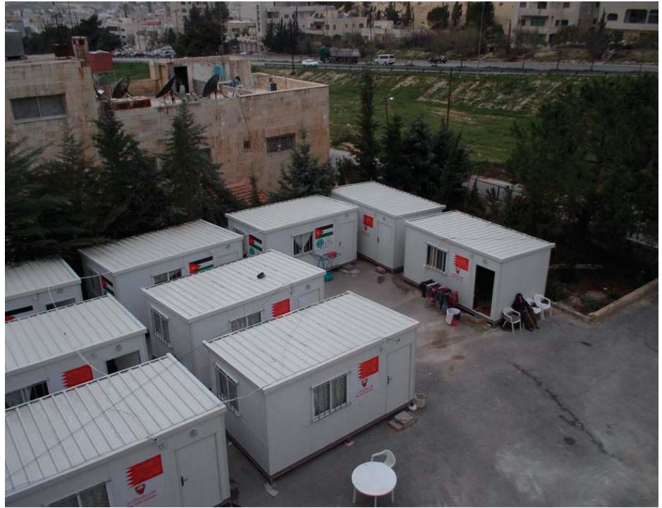
Dans une paroisse jordanienne du Patriarcat latin : caravanes installées pour accueillir les réfugiés d'autres pays du Moyen-Orient.