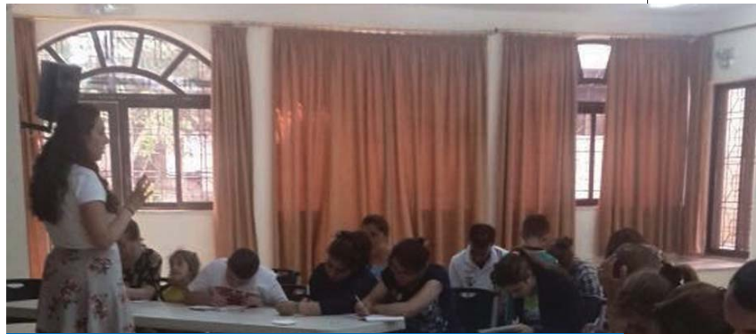
Des cours sont dispensés aux réfugiés, afin de leur redonner confiance en l'avenir.

La Lieutenance du Portugal a directement pris à cœur le quotidien des enfants de ces