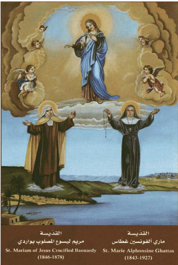
L'image des deux saintes palestiniennes en compagnie de Notre-Dame de Palestine, qui veillent ensemble sur la Terre Sainte et sur tous ses habitants.

n'est jamais la souffrance, ce n'est jamais l'abandon, ce n'est pas la croix mais la gloire, la résurrection et la lumière. Le Calvaire n'est pas la dernière parole, mais la porte vers une vie meilleure ».