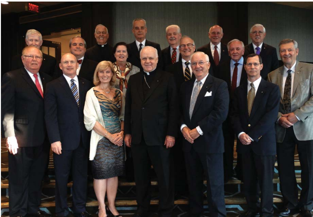
Der Großmeister des Ordens vom Heiligen Grab zusammen mit den Statthaltern von Nordamerika in Québec im Juni 2015. (Einen Bericht über diese Versammlung lesen Sie in unserem nächsten Newsletter.)