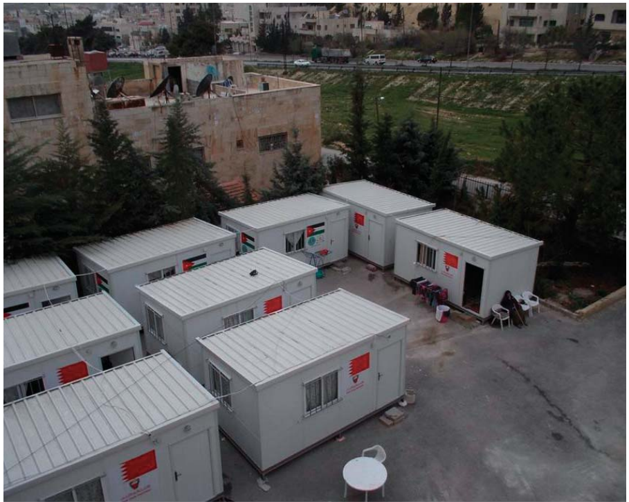
Wohnwagen für Flüchtlinge im Nahen Osten, in einer jordanischen Gemeinde des lateinischen Patriarchates.

Mit 67 Gemeinden und 43 Schulen für 90.000 katholische Gläubige des lateinischen Ritus (42.000 in Jordanien, 30.000 in Israel und 18.000 in Palästina), steht das Lateinische Patriarchat von Jerusalem zahlreichen Herausforderungen gegenüber, die von Zypern über Israel und die Palästinensergebiete bis Jordanien reichen. Um sich ihnen zu stellen, unterstützt der Orden vom Heiligen Grab jedes Jahr verschiedene Projekte zusätzlich zur monatlichen Beihilfe, die dem Patriarchat für Einrichtungen wie zum Bei-