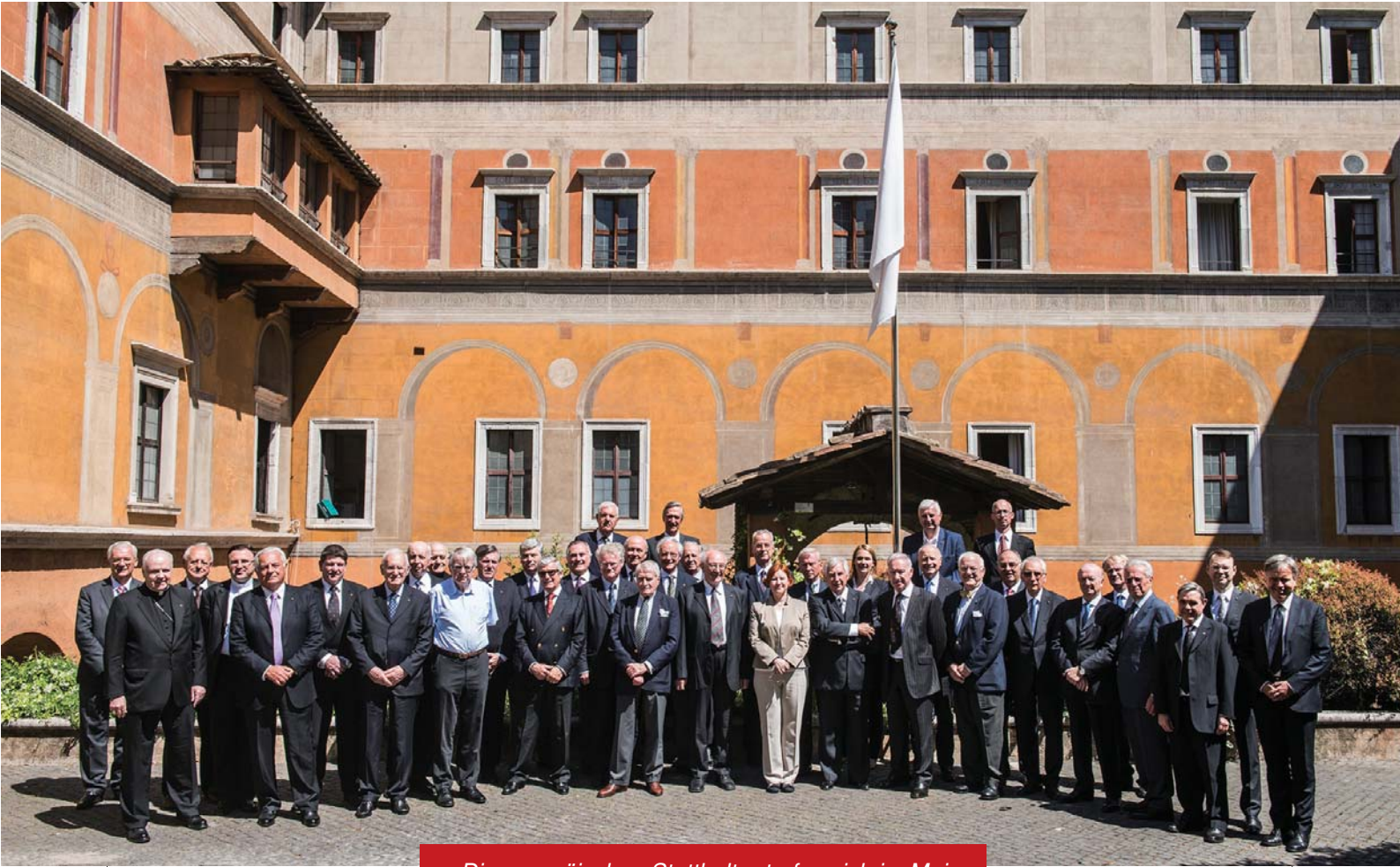
Die europäischen Statthalter trafen sich im Mai 2015 im Palazzo Della Rovere.

den des Lateinischen Patriarchates von Jerusalem finden, und zwar insbesondere im haschemitischen Königreich Jordanien.