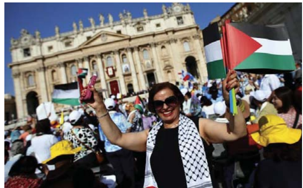
Die palästinensischen Christen, die als Delegation nach Rom kamen, ließen ihrer Freude bei der Feier am 17. Mai 2015 freien Lauf und würdigten so das Zeugnis ihrer heiliggesprochenen Landsmänninnen, der heiligen Mariam und der heiligen Maria-Alfonsina.

Vater über den „Gehorsam dem Heiligen Geist gegenüber“, der Mariam Bawardi auszeichnete und „sie auch zu einem Mittel der