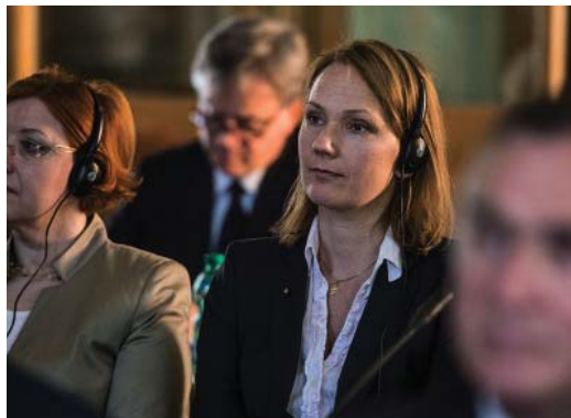
Die Magistraldelegierte von Norwegen, Gattin und Familienmutter, hier bei der jüngsten Arbeitssitzung im Großmagisterium des Ordens.