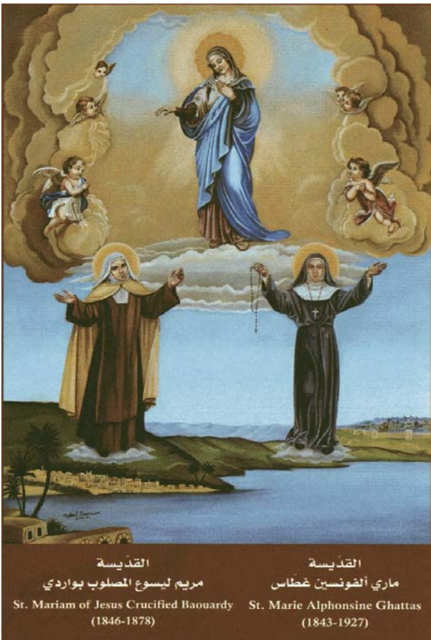
Bild der beiden palästinensischen Heiligen in Begleitung Unserer Lieben Frau von Palästina: Gemeinsam wachen sie über das Heilige Land und all seine Bewohner.

Gebetsabend teilnahm: „Diese beiden Heiligen lehren uns, dass das Leiden, die Verlassenheit, das Kreuz nie das letzte Wort haben, sondern die Herrlichkeit, die Auferstehung und das Licht. Der Kalvarienberg hat nicht das letzte Wort, denn er ist die Pforte, die zu einem besseren Leben führt.“