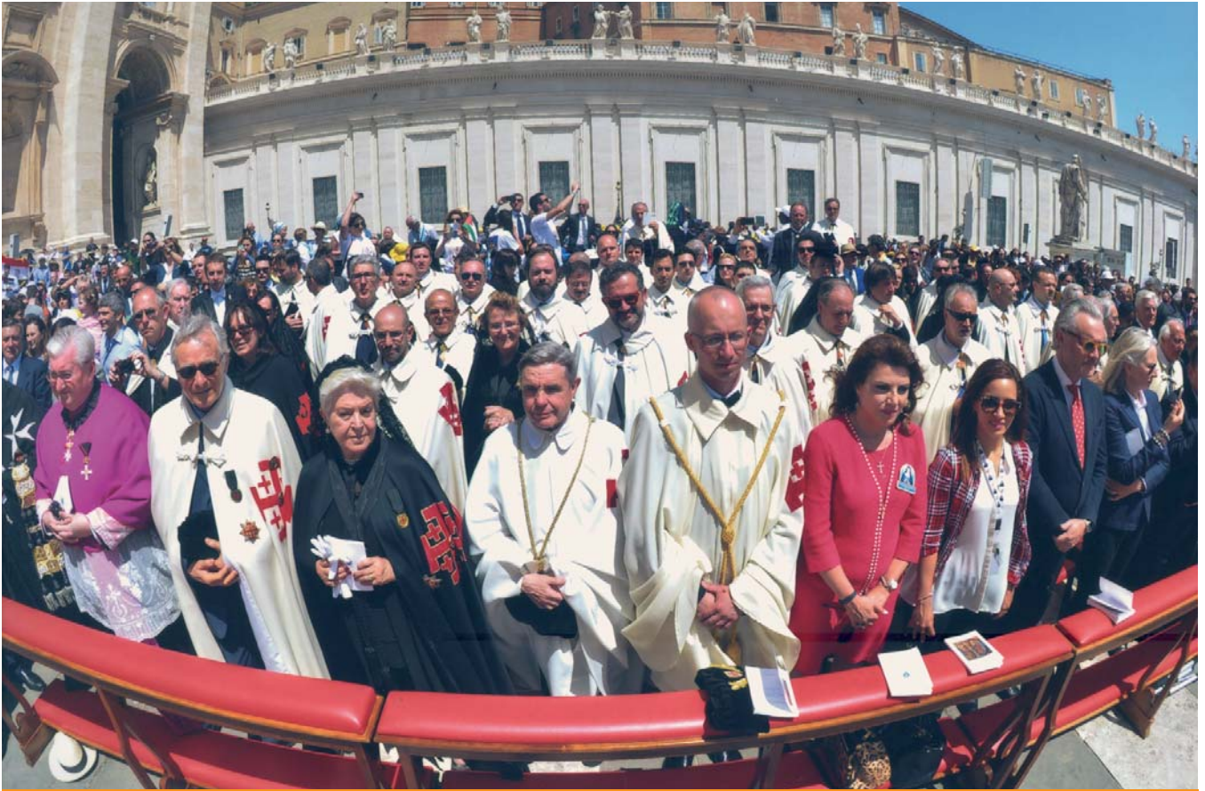
Ritter und Damen des Ordens vom Heiligen Grab auf dem Petersplatz bei der Heiligsprechung der beiden palästinensischen Heiligen.

Begegnung und der Gemeinschaft mit der muslimischen Welt machte". Und bezüglich Maria-Alfonsina Danil Ghattas betonte er, wie „genau sie begriffen hatte, was es heißt, die Liebe Gottes im Apostolat auszustrahlen, indem man Zeuge der Sanftmut und der Einheit wird. Sie gibt uns ein leuchtendes Beispiel dafür, wie wichtig es ist, füreinander verantwortlich zu sein und im Dienst aneinander zu leben.“