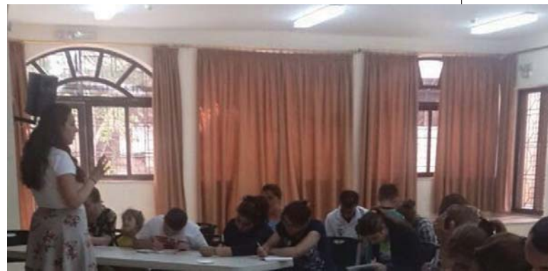
Se imparten clases a los refugiados para que retomen confianza en el futuro.

La Lugartenencia de Portugal se ha tomado a pecho la vida diaria de los niños de es-