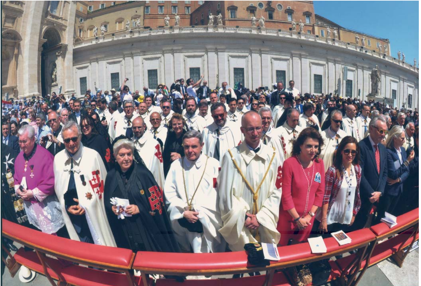
Caballeros y Damas de la Orden del Santo Sepulcro en la plaza de San Pedro durante la canonización de las dos santas palestinas.

dió bien qué significa irradiar el amor de Dios en el apostolado, convirtiéndose en testigo de mansedumbre y unidad. Ella nos da un claro ejemplo de lo importante que es ser responsables los unos de los otros, vivir al servicio el uno del otro”.