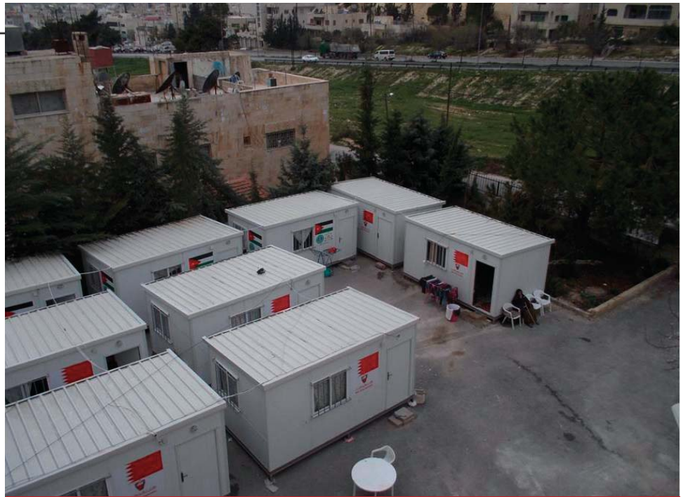
En la parroquia jordana del Patriarcado latino: caravanas instaladas para acoger a los refugiados de otros países de Oriente Medio.