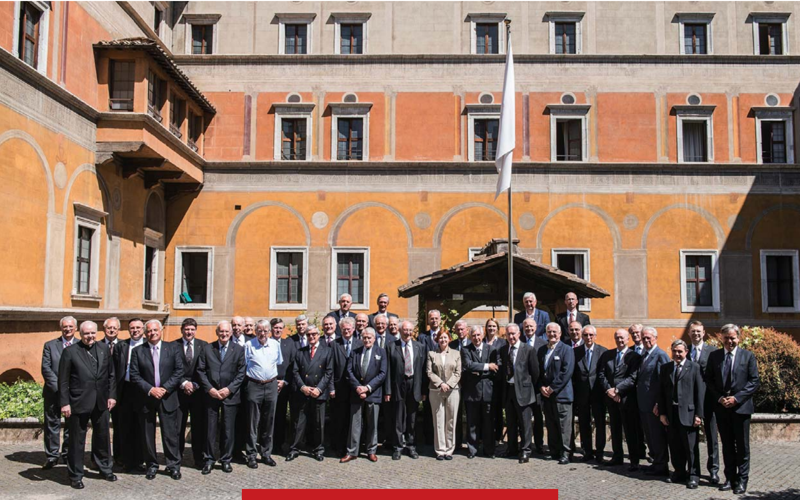
Los Lugartenientes europeos reunidos en el Palazzo Della Rovere, en mayo de 2015.

tribuir así a movilizarlos a favor de los cristianos de Oriente de los cuales muchos miembros han encontrado refugio en las parroquias del Patriarcado latino de Jerusalén, en particular en el Reino hachemita de Jordania.