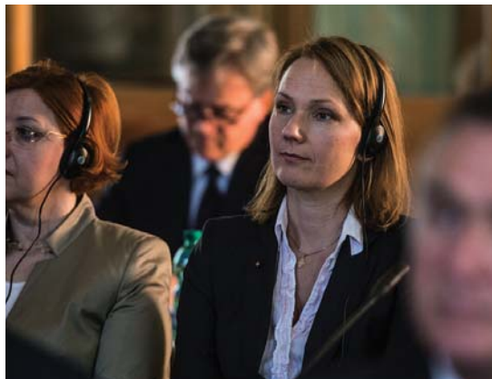
La Delegada Magistral de Noruega, esposa y madre de familia, durante una reciente reunión de trabajo en el Gran Magisterio de la Orden.