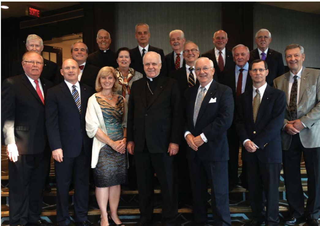
El Gran Maestro de la Orden del Santo Sepulcro rodeado por los Lugartenientes de América del Norte, en Quebec, en junio de 2015 (en nuestra próxima Newsletter encontrarán un resumen de este encuentro).