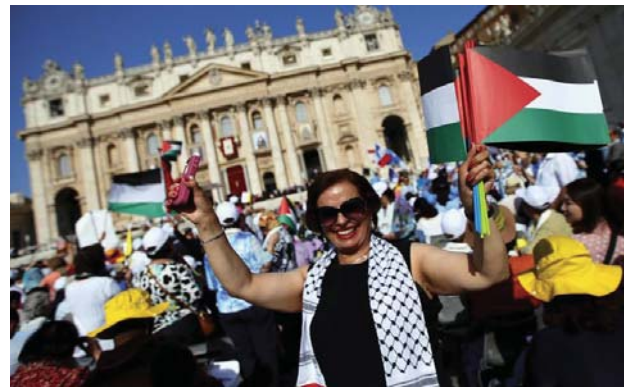
Los cristianos palestinos, que enviaron a Roma una delegación, manifestaron su alegría durante la celebración del 17 de mayo de 2015, rindiendo homenaje al testimonio de sus compatriotas canonizadas: santa Mariam y santa Marie-Alphonsine.

Durante la homilía, el Santo Padre, evocó