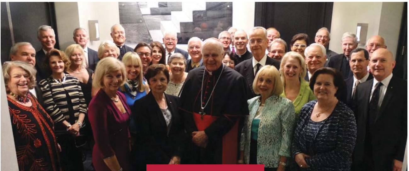
Los Lugartenientes de América del Norte y sus cónyuges durante la reunión que tuvo lugar en Baltimore, Estados Unidos, el pasado mes de junio.

A principios del mes de junio, los Lugartenientes de América del Norte se reunieron para su encuentro anual en Baltimore, en el Maryland. Se trataba del primer encuentro de Lugartenientes en la primera Sede episcopal de los Estados Unidos.