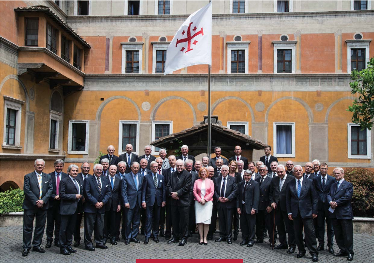
Los Lugartenientes de toda Europa rodeando al cardenal O'Brien durante la reunión de primavera en la sede internacional de la Orden en Roma.

internet, en cinco idiomas, del Gran Magisterio que va a favorecer la comunicación internacional de la Orden ( www.oessh.va ).