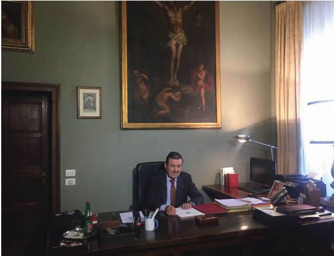
Le nouveau Gouverneur Général dans son bureau du Palazzo della Rovere.