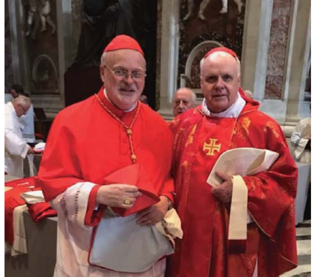
Le nouveau cardinal Anders Arborelius, membre suédois de l'Ordre, en compagnie du Grand Maître, à l'occasion du Consistoire de juin dernier à Rome.

Parmi les récentes nominations importantes du Saint-Père, deux autres membres éminents de l'Ordre ont été honorés de sa confiance : le nouveau président de la Conférence épiscopale italienne en la personne du cardinal Gualtiero Bassetti, archevêque de Pérouse, Chevalier de Grand Croix et Prieur de la section Ombrie, ainsi que le nouveau Vicaire du Pape pour le diocèse de Rome, Mgr Angelo De Donatis, membre de l'Ordre depuis une trentaine d'années. Nous confions la mission de ces pasteurs à l'inter-