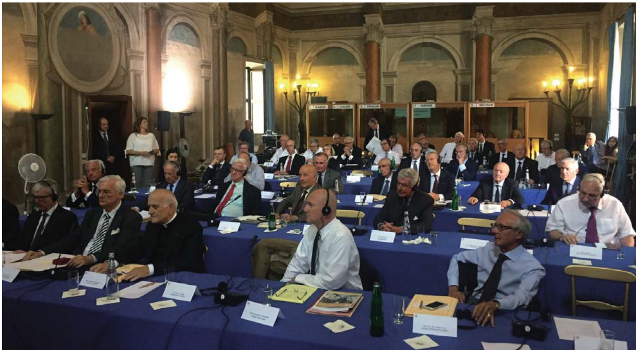
Une séance de travail des Lieutenants européens dans une des salles du Palazzo della Rovere, siège de l’Ordre à Rome.