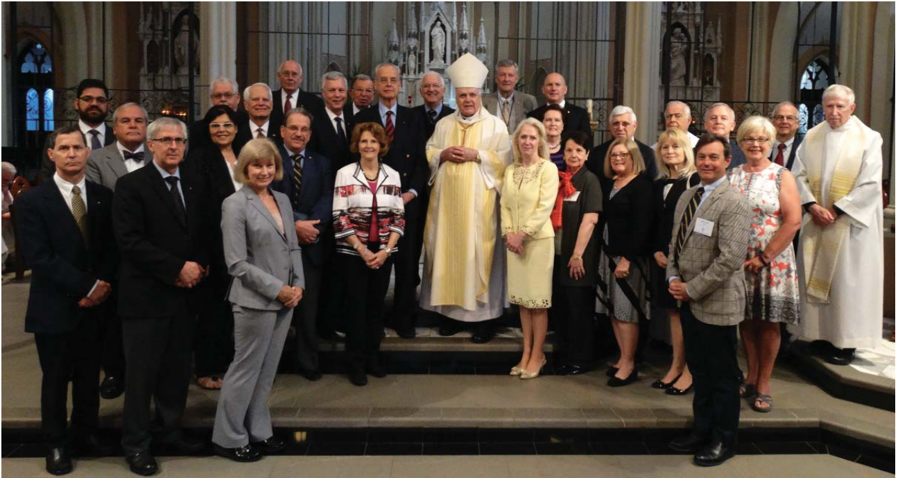
Une photo de groupe prise à l'église St John de la Creighton University à Omaha, durant la rencontre annuelle des Lieutenances d'Amérique du Nord.