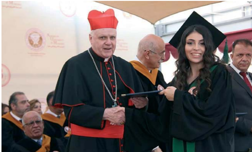
Le Grand Maître a remis les diplômes aux étudiants de l'Université de Madaba, cet été en Jordanie.

Pour le mois de septembre est déjà prévue la visite du Grand Maître aux Lieutenances pour Malte et pour la France, à l'occasion de leurs cérémonies d'Investiture respectives (les 22 et 23 septembre, puis les 30 septembre et 1 er octobre).