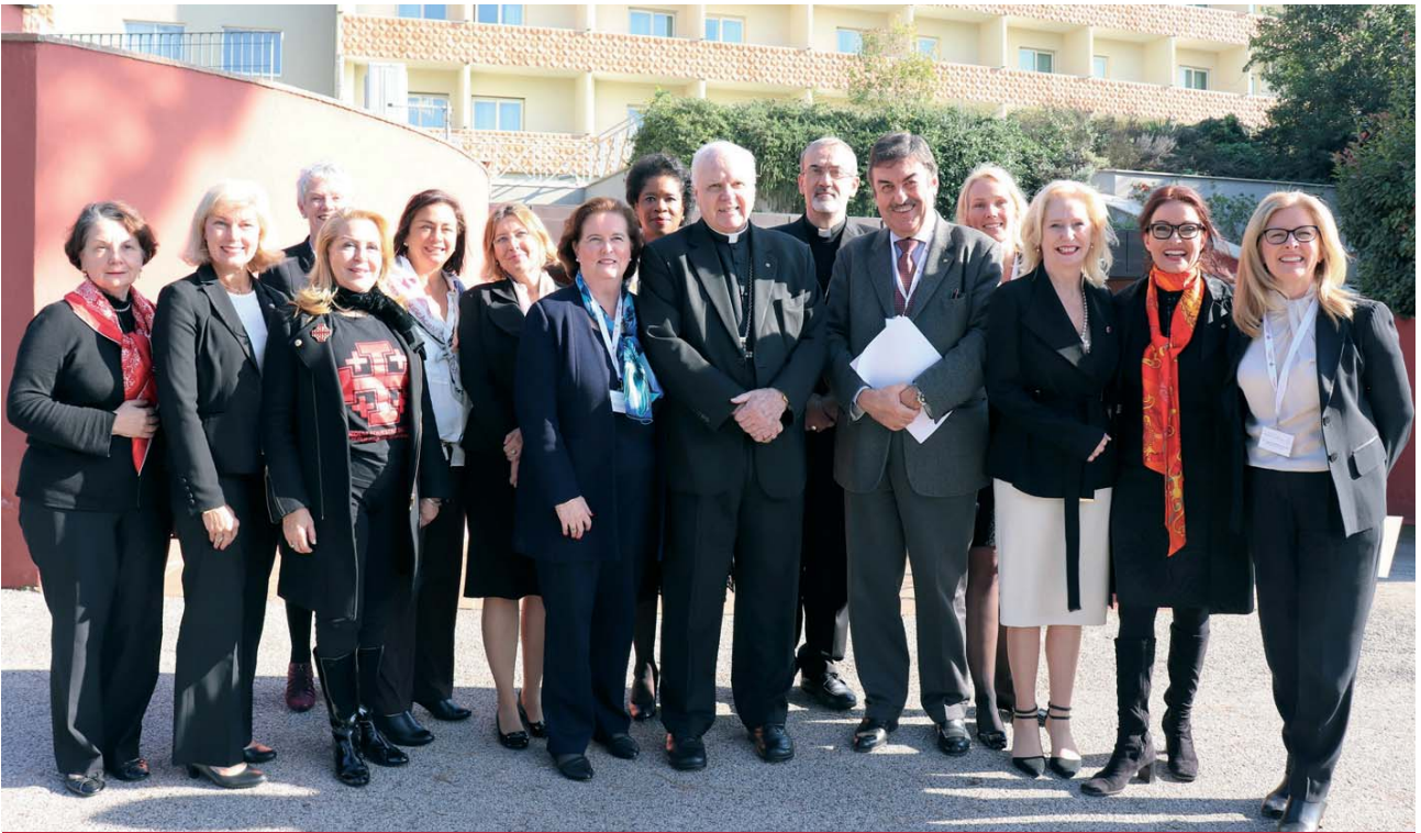
Las mujeres con responsabilidades al mando de las Lugartenencias de la Orden enriquecieron la Consulta con su sensibilidad particular, favoreciendo un ambiente familiar que los participantes apreciaron y que desean ahora seguir cultivando.

cho de que la Orden es «la única institución laica de la Santa Sede que se ocupa de la presencia cristiana en Tierra Santa», preparando especialmente un futuro de respeto y colaboración entre los habitantes de diferentes religiones a través de las obras de educación.