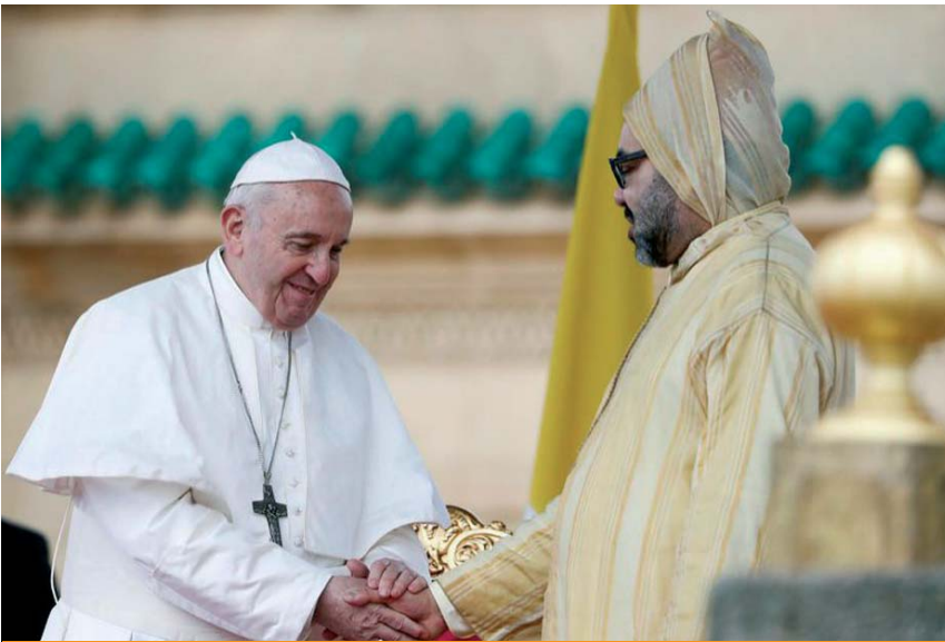
Durante el encuentro privado en el Palacio Real de Rabat, Mohamed VI y Francisco firmaron un llamamiento común reconociendo la unicidad y la sacralidad de Jerusalén.

tos que pueden ayudarlo a salvarse de la debilidad, la división, el conflicto y el declive científico, técnico y cultural», recuerda este documento, «símbolo del abrazo entre Oriente y Occidente, entre el Norte y el Sur y entre todos los que creen que Dios nos ha creado para conocernos, para cooperar entre nosotros y vivir como hermanos que se aman».