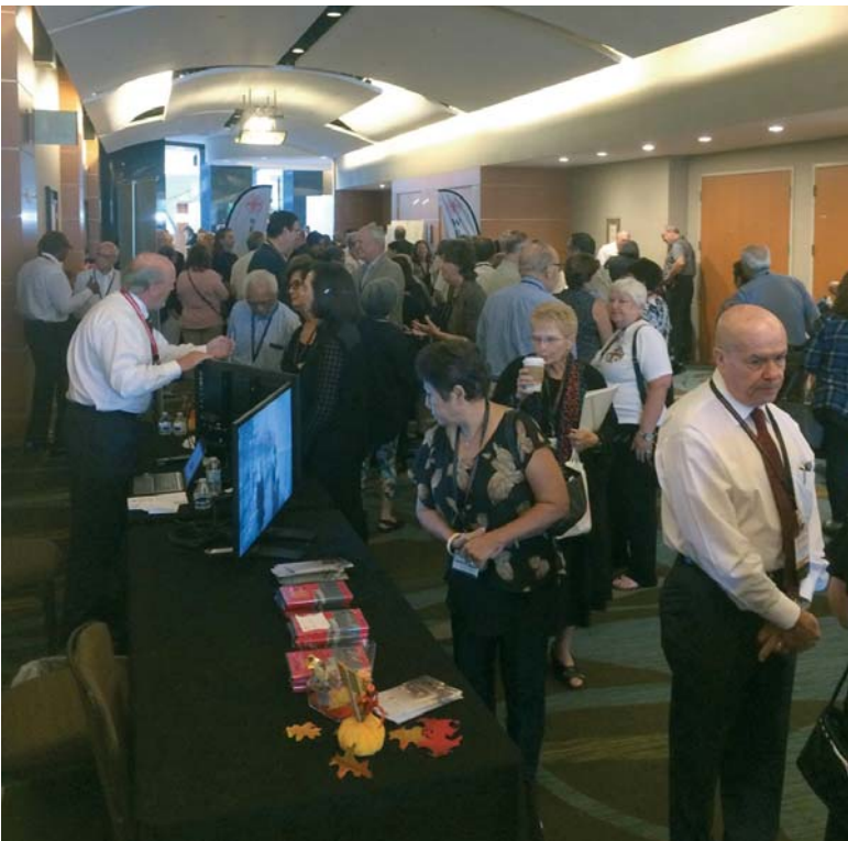
La Lugartenencia de USA Western presenta los proyectos realizados en Tierra Santa durante una fiesta anual que suscita tanto interés como generosidad.