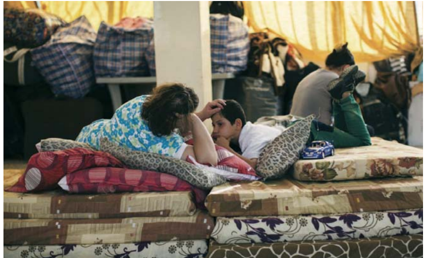
Le Patriarcat latin de Jérusalem, avec l'aide de l'Ordre, a fourni une aide humanitaire à plus de 11 000 familles irakiennes déplacées.

En outre, le Patriarcat latin de Jérusalem a