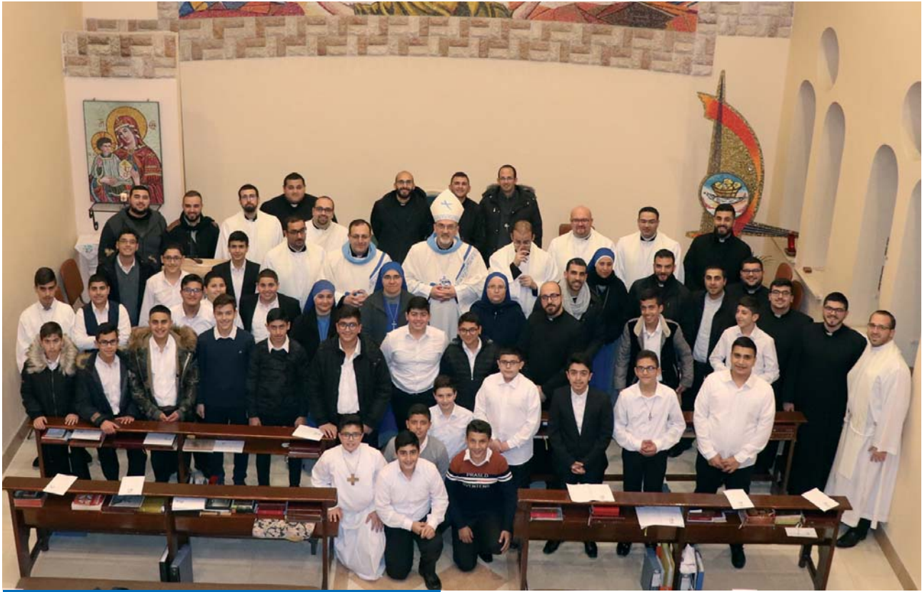
Mgr Pierbattista Pizzaballa avec les séminaristes de son diocèse et l'équipe de leurs formateurs, à Beit Jala, en Palestine.

naire Saint Joseph à New York, trois années de théologie, une année pastorale et une année finale au séminaire pour l'ordination diaconale et sacerdotale.