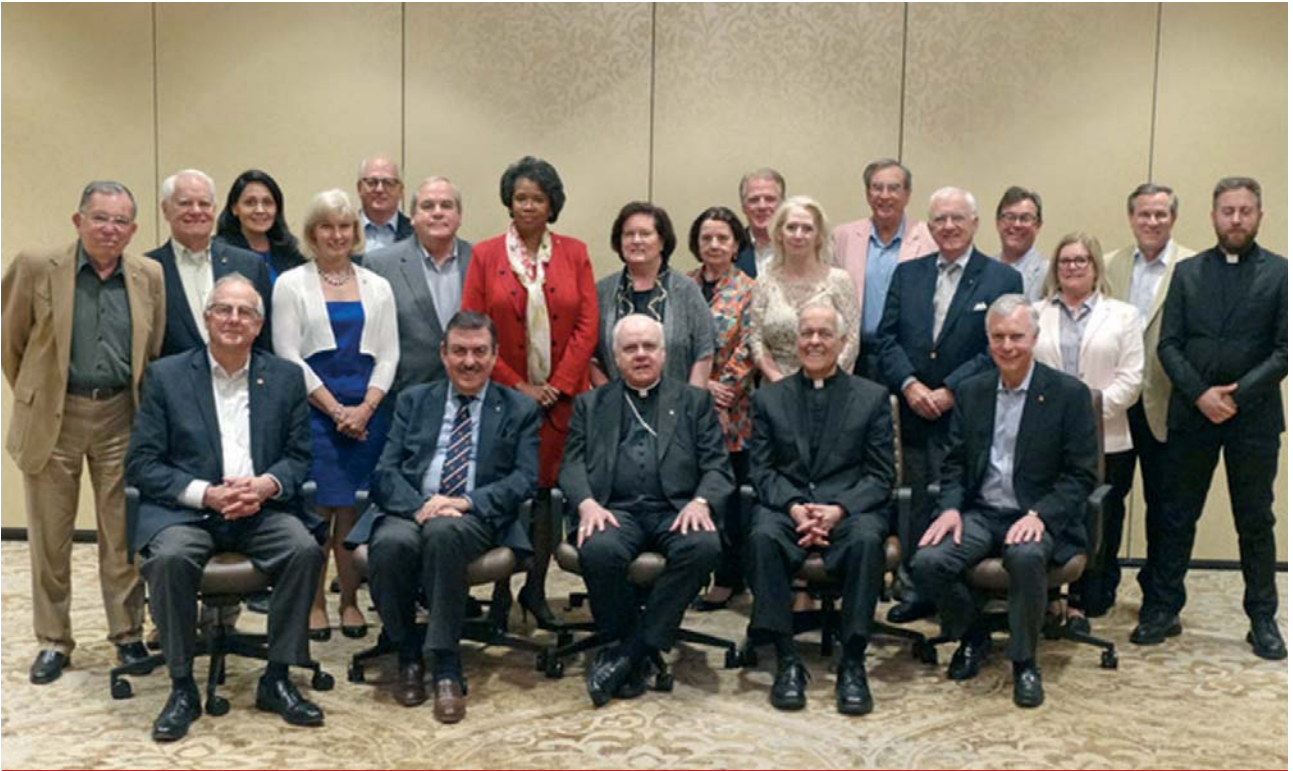
Les participants de la rencontre des Lieutenants nord-américains à Houston.