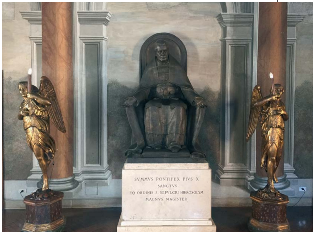
La statue de saint Pie X préside aux grandes réunions continentales et internationales organisées par le Grand Magistère, au Palazzo della Rovere, à quelques mètres de la place Saint-Pierre.

1914, quelques jours après le début de la première guerre mondiale, il est actuellement le seul saint canonisé ayant appartenu à l'Ordre du Saint-Sépulcre, dont il a été le Grand Maître. Pour consolider la position de l'Ordre en Terre Sainte, saint Pie X réserva pour lui et ses successeurs la charge de Grand Maître par la lettre apostolique Quam multa du 13 octobre 1908 et accorda aux Chevaliers une place dans les chapelles papales, tandis que le Patriarche Latin était désigné comme Recteur et administrateur perpétuel de l'Ordre.