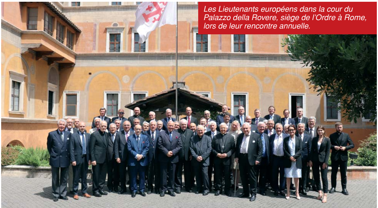
Les Lieutenants européens dans la cour du Palazzo della Rovere, siège de l'Ordre à Rome, lors de leur rencontre annuelle.