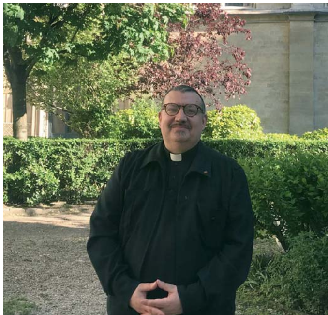
Le Père Fournier, Chevalier du Saint-Sépulcre, a témoigné mondialement de la mission de l'Ordre en sauvant les reliques de la couronne d'épines durant l'incendie qui a ravagé Notre-Dame de Paris.

La manière dont est organisée la lieutenance de France fait que dans chaque commanderie, il est à la fois important de soutenir le Patriarcat latin mais tout autant de travailler à sa sanctification personnelle. Dans l'ordre de la grâce, il faut d'abord être empli de grâce, comme l'était la Sainte Vierge et ensuite vous pouvez en faire bénéficier les autres autour de vous de manière plus efficace encore. Ainsi, le chevalier, pour être encore plus efficace dans l'aide qu'il peut apporter autour de lui et dans son rayonne-