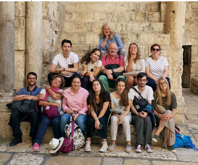
Eine Gruppe von Ehrenamtlichen der Statthalterei für Westspanien verbrachte im Sommer zwei Wochen beim Dienst im Heiligen Land.