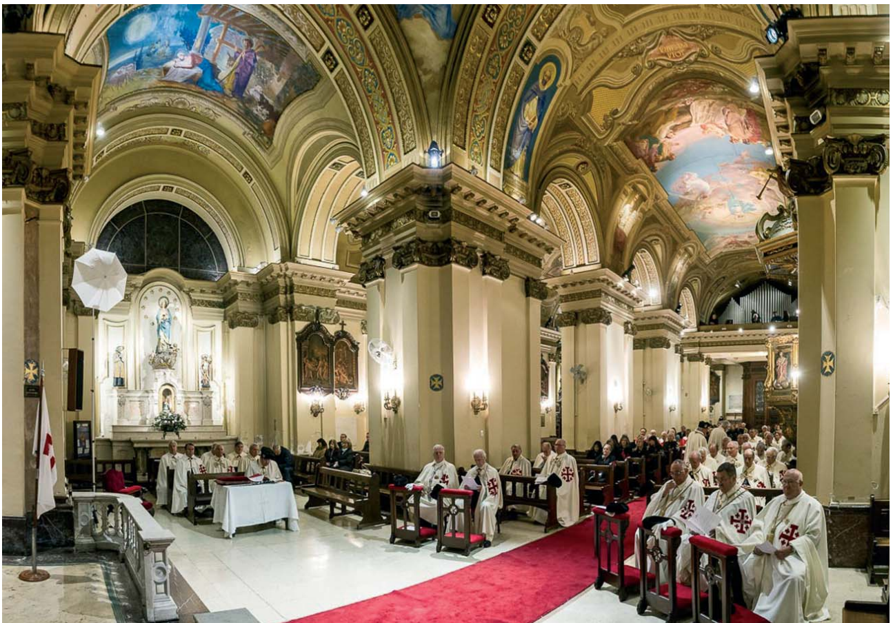
Die Investitur der neuen Mitglieder des Ordens in Argentinien, der Heimat von Papst Franziskus, war einer der Höhepunkte des Besuchs des Generalgouverneurs diesen Sommer in Lateinamerika. Es ist den Rittern und Damen in Argentinien ein Anliegen, sich immer mehr in das Leben der Ortskirche einzubringen.