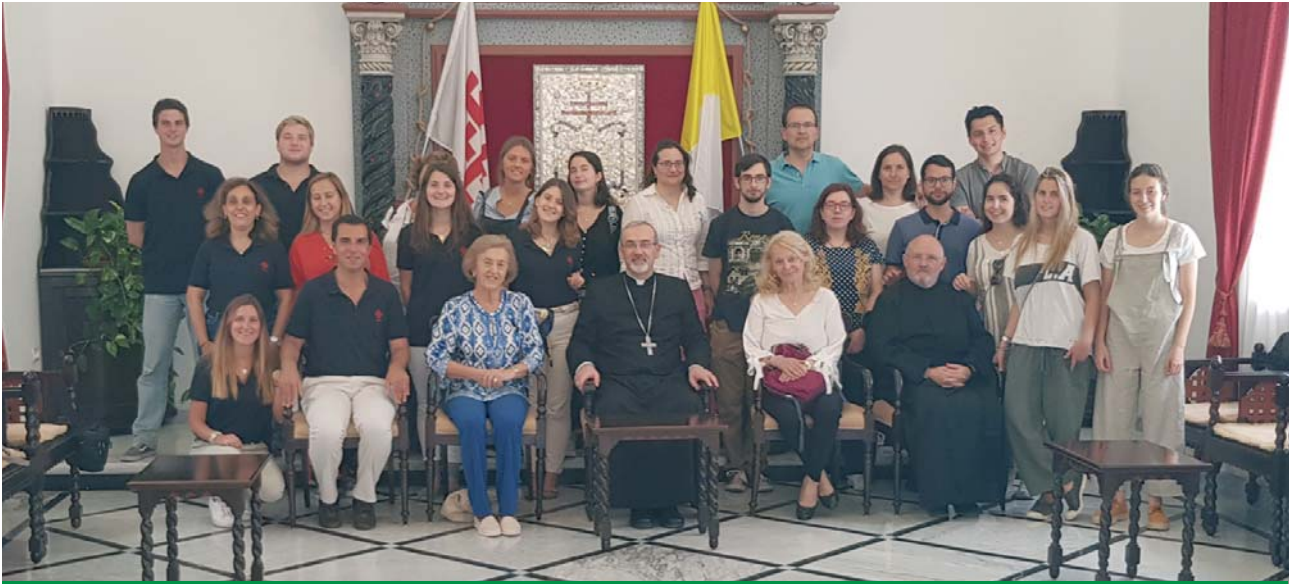
Msgr. Pierbattista Pizzaballa, dem Apostolischen Administrator des Lateinischen Patriarchats von Jerusalem, war es ein Anliegen, den jungen spanischen und portugiesischen Ehrenamtlichen seine Dankbarkeit zu bekunden, indem er sie offiziell am Sitz seines Bistums empfing.

scheidenen Haus in Nazareth lebte, eine so wichtige Mission anvertraut hatte. Doch genau darin erkennen wir die Größe Gottes: Er schaut auf das Herz. Und im Herzen Mariens fand er ein fröhliches Ja, eine völlige Hingabe an seine Liebe."