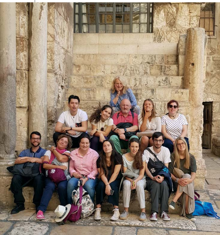
Un grupo de voluntarios de la Lugartenencia para España Occidental pasó dos semanas de servicio en Tierra Santa durante el verano.