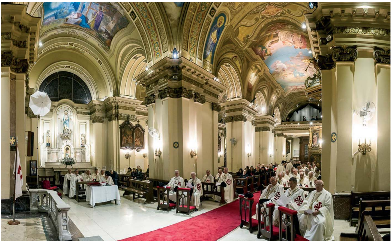
La investidura de nuevos miembros de la Orden en Argentina, país de origen del papa Francisco, fue uno de los grandes momentos de la visita del Gobernador General a América Latina durante el verano. Los Caballeros y Damas de Argentina se comprometen a implicarse cada vez más en la vida de la Iglesia local.

tes de las Lugartenencias en esa ciudad. Este segundo viaje respondía a varios objetivos, entre ellos el de hacer que los dirigentes de la Orden actúen en perfecta armonía con las orientaciones del Gran Magisterio en Roma y con el Episcopado local, siguiendo las directrices del Santo Padre. Las dificultades de comunicación no han favorecido la vida de la Orden estos últimos tiempos en Argentina, pero durante un encuentro con los responsables de la Iglesia local se han creado las bases dejando esperar un diálogo más constructivo. En Argentina, el 90% de los habitantes declaran ser católicos, pero el porcentaje de personas que practican la religión es claramente inferior. Ahora que el país atraviesa un periodo difícil, es imprescindible que toda la comunidad católica sostenga una participación más intensa en las actividades de las diócesis. Esta recomendación ha sido dirigida por el Gobernador General