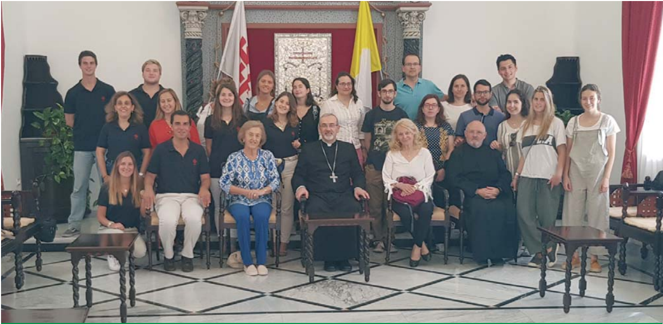
Mons. Pierbattista Pizzaballa, Administrador apostólico del Patriarcado latino de Jerusalén, manifestó su gratitud a los jóvenes voluntarios españoles y portugueses, invitándolos oficialmente en la sede de su obispado.

en Nazaret. Pero precisamente en esto se ve la grandeza de Dios: mira al corazón. Y en el corazón de María encontró un sí gozoso, un abandono total a su amor».