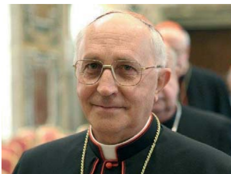
El cardenal Fernando Filoni sucede al cardenal Edwin O'Brien a la cabeza de la Orden del Santo Sepulcro.

Por último, doy la bienvenida a Su Eminencia el cardenal Filoni como Gran Maestro. Su larga y amplia experiencia pastoral y administrativa al servicio de la Iglesia universal le será un valioso activo para guiar nuestra Orden hacia el futuro. Le ofrezco mi apoyo total y fraterno orando por la constante intercesión de Nuestra Señora de Palestina».