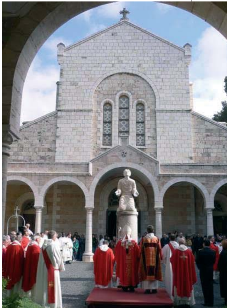
La estatua del diácono san Esteban, erigida gracias a la Orden, recuerda a todos que la Iglesia quiere ser ante todo sierva y pobre.

M e gustaría expresar aquí mi agradecimiento hacia la Orden por el apoyo prestado desde hace años a la famosa Escuela Bíblica de Jerusalén. Estas líneas tienen un tono personal ya que tuve el honor de haber sido elegido como responsable de la Escuela Bíblica y Arqueológica Francesa de Jerusalén en 1999 y reelegido en dos ocasiones, hasta 2008. Hasta entonces yo enseñaba en la Facultad de Teología de la Universidad de Friburgo, en Suiza. Una tarde en Jerusalén, mientras paseaba y rezaba en el atrio de la basílica de san Esteban, construida en 1900 sobre los restos de una iglesia bizantina del siglo V, vi que en medio del atrio, sobre el suelo de tierra batida con antiguas baldosas bizantinas, se levantaba una columna vacía. En efecto, el santo mártir no solo fue lapidado en el siglo primero sino que su imagen también fue víctima de una bomba durante el fragor de la guerra de 1947. Después de cinco años, los religiosos terminaron por enterrar la imagen decapitada del santo en su jardín. De pronto, me entraron ganas de devolverle su lugar de honor frente a la basílica. Entonces no tenía ni di-