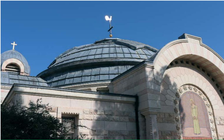
La basílica de San Pedro en Gallicantu, erigida allí donde Jesús fue interrogado por el Sumo Sacerdote Caifás y los jefes de la Sinagoga, es uno de los lugares de peregrinación más significativos de Jerusalén.