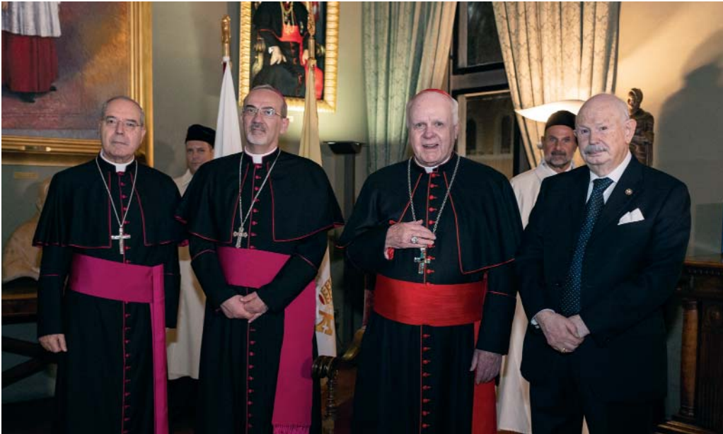
El Gran Maestre de la Orden de Malta (a la derecha de nuestra foto) estuvo junto al Gran Maestre de la Orden del Santo Sepulcro en la recepción organizada en el Palazzo della Rovere con motivo de la fiesta de Nuestra Señora de Palestina.