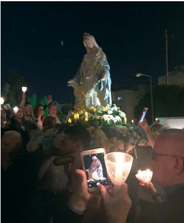
Los miembros de la Comisión de Tierra Santa participaron en la procesión pública en Ammán durante la vigilia de la fiesta de la Exaltación de la Santa Cruz.

cuestión de los refugiados – cuya importancia no disminuye – también ha sido objeto de la atención de la Comisión. Por lo que se refiere a los refugiados sirios, «aproximadamente el 25% de los niños en edad escolar no tienen acceso a la educación, lo que no puede considerarse “normal”», afirmó la Comisión en su informe de la visita.