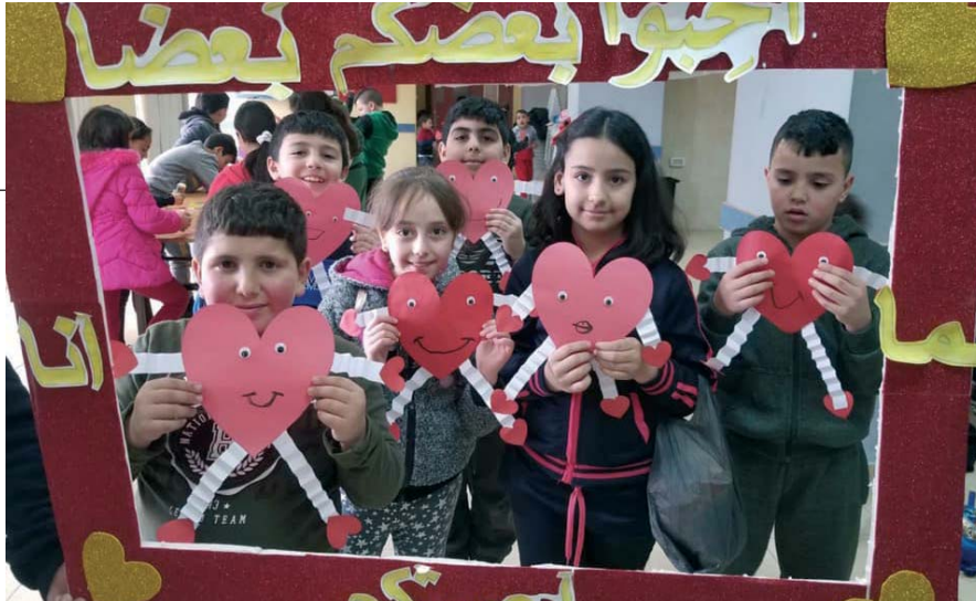
La ayuda a la educación en Tierra Santa es más que nunca una prioridad para la Orden.

la secretaría y que a veces se pronunciaban de manera improvisada, ahora están disponibles en su versión original con un texto muy preciso y razonado, lo que proporciona una documentación útil y fácil de divulgar. Además, la reunión virtual ha reducido considerablemente los gastos de viaje, alojamiento y comidas de los participantes, la traducción simultánea y el alquiler de las salas, circunstancia que no es de menor importancia en un momento de restricciones económicas y de necesidad de asignar todos los recursos posibles a Tierra Santa.