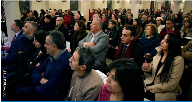
La comunidad parroquial de Beit Sahour durante una misa, antes de la prohibición de las celebraciones debido a la pandemia.

ta cómo pudo estar cerca de los parroquianos durante estos días: «En nuestra parroquia de Beit Sahour, de acuerdo con las autoridades civiles, pude llevar la comunión a los fieles en sus casas durante la Semana Santa. Llamé a cada familia por teléfono para saber si querían recibir la comunión en relación con las celebraciones transmitidas desde la catedral. La mayoría de las familias (unas 250) pudieron recibir la comunión durante esos cuatro días».