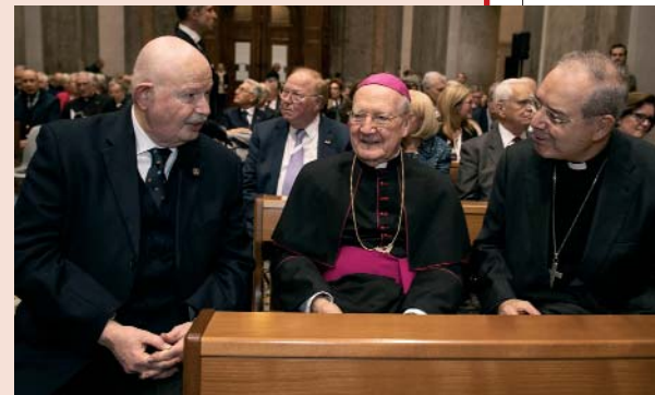
El Gran Maestre de la Orden de Malta había honrado con su presencia la velada espiritual organizada durante la consulta de la Orden del Santo Sepulcro en 2018, en torno al oratorio del Beato Bartolo Longo, creado para la ocasión.