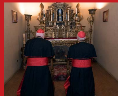
Recibimiento oficial del cardenal Fernando Filoni en el Palazzo della Rovere el 16 de enero de 2020.