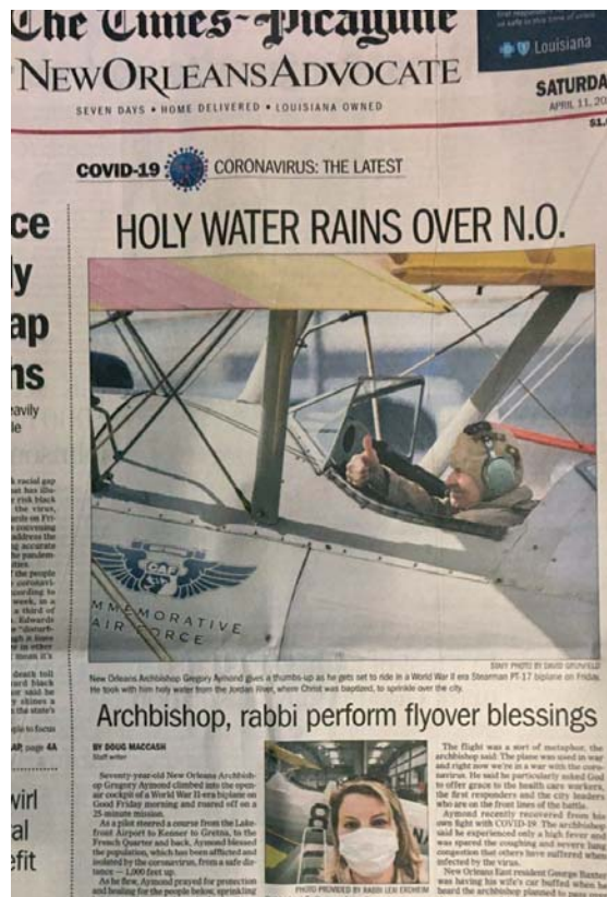
El periódico New Orleans Times-Picayune, que tiene un fuerte reconocimiento nacional en Estados Unidos, informó sobre la «bendición aérea» realizada por el Gran Prior de la Lugartenencia del Sudeste de los Estados Unidos durante el peor período de la pandemia.