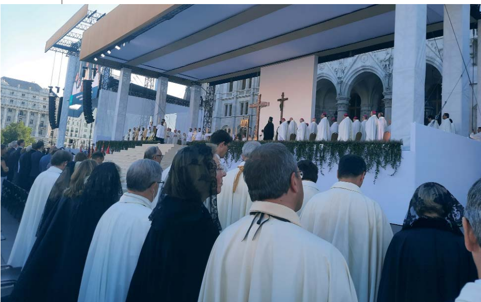
La Orden del Santo Sepulcro colabora en el renacimiento espiritual de Europa, como deseaba el cardenal Erdő en Budapest.

La misa de clausura del Congreso eucarístico internacional fue celebrada por el Santo Padre delante de 250 000 fieles el 12 de septiembre por la mañana, con la participación numerosa de Caballeros y Damas del Santo Sepulcro, entre los que se encontraban varios que habían estado muy implicados en la organización del acontecimiento. Estas jornadas son para todos una buena base a partir de la cual se podrá volver a empezar para convertirnos en colaboradores del renacimiento espiritual de Europa, deseada por el cardenal Péter Erdő y el papa Francisco.