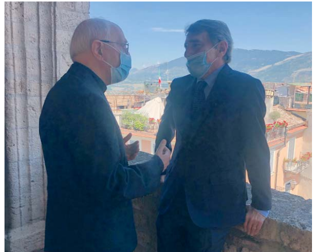
El Gran Maestre y el presidente del Parlamento Europeo, David Sassoli, hablaron largo y tendido sobre las raíces cristianas de Europa durante la entrega del Premio Internacional Bonifacio VIII al cardenal Fernando Filoni.

El contexto actual es ciertamente diferente, pero también en este año 2021 tenemos gran necesidad de la misericordia de Dios y de las peregrinaciones a Tierra Santa, una experiencia tan importante para los Caballeros y Damas que se acentúa por su pertenencia a la Orden del Santo Sepulcro, pero que no es fácil de realizar debido a las complejas condiciones sanitarias en todo el mundo y en cada país.