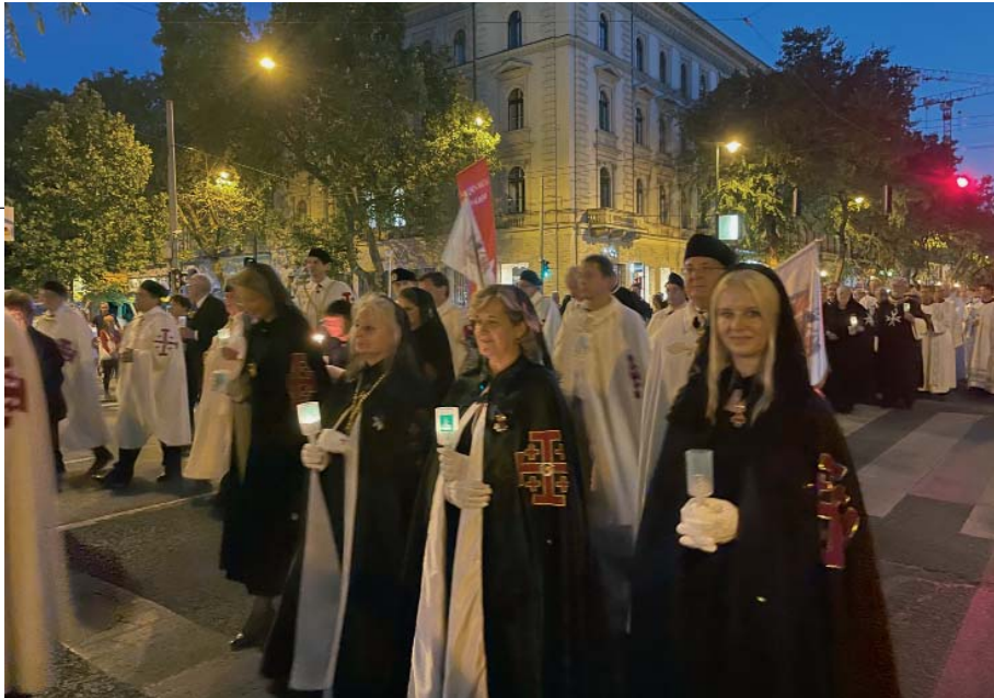
La participación de los Caballeros y Damas en el congreso eucarístico internacional demostró el compromiso de los miembros de la Orden con la vida de la Iglesia universal.

Después de la misa del 11 de septiembre de 2021, presidida por el cardenal Péter Erdő, Primado de Hungría, arzobispo de Esztergom-Budapest y Gran Prior de la Lugartenencia para Hungría, delante del edificio del Parlamento húngaro, una gran procesión eucarística con centenas de millares de fieles