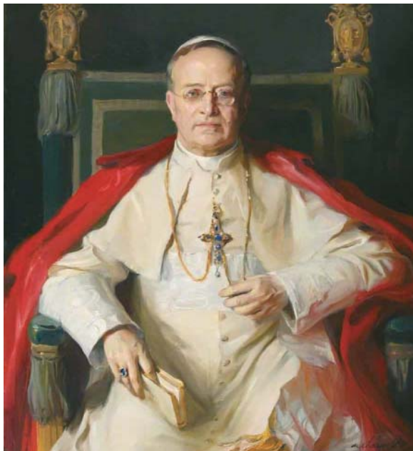
El papa Pío XI, que fue Gran Maestro de la Orden del Santo Sepulcro, trabajó mucho para apoyar a los cristianos de Tierra Santa.