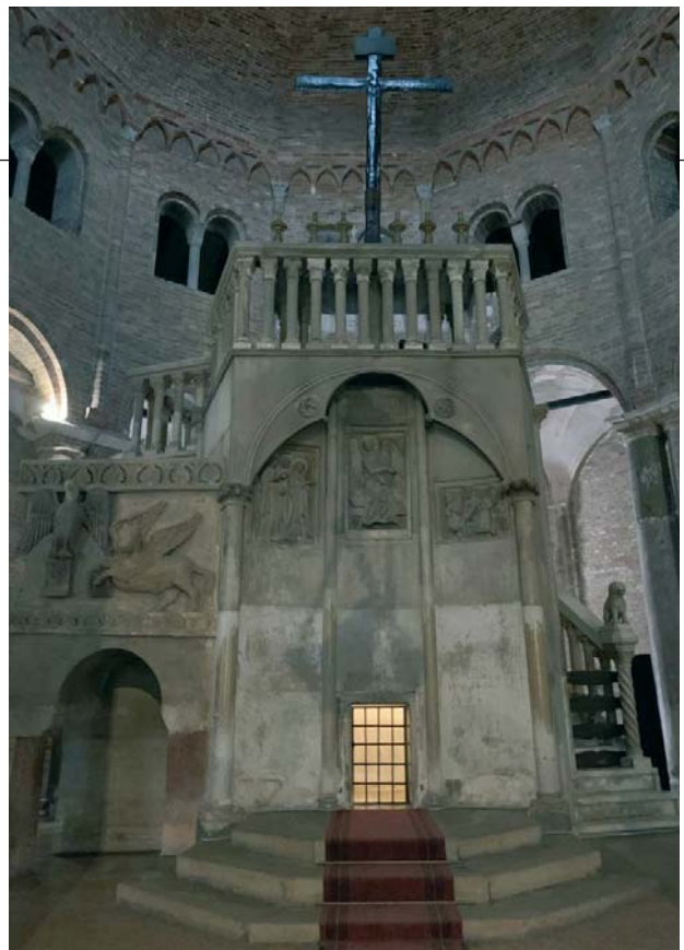
La reproducción del Santo Sepulcro en Bolonia marcó simbólicamente la apertura y la clausura de este gran encuentro de líderes religiosos y políticos en el marco del Foro interreligioso del G20.

Domingo de Caleruega comprendió que aquí, en Bolonia, se estaba preparando el futuro. Quería que su comunidad estuviera presente entre los estudiantes de la universidad para enriquecer su entendimiento y construir a las personas con la luz de la fe que abre su corazón a los demás. Pocos saben que Santo Domingo está enterrado en Bolonia, pero su mensaje actual merece ser resaltado en relación con este G20: es el hombre de la comunidad, de la fraternidad. La mesa de Mascarella en la que se pintó el primer retrato de santo Domingo poco después de su canonización, elegida este año como símbolo del octavo centenario del Dies Natalis del santo, lo muestra en el refectorio con sus hermanos, cuyos rostros evocan diferentes orígenes étnicos . Vivió en una época de transición y puede inspirarnos profundamente en estos tiempos de cambio que vivimos.