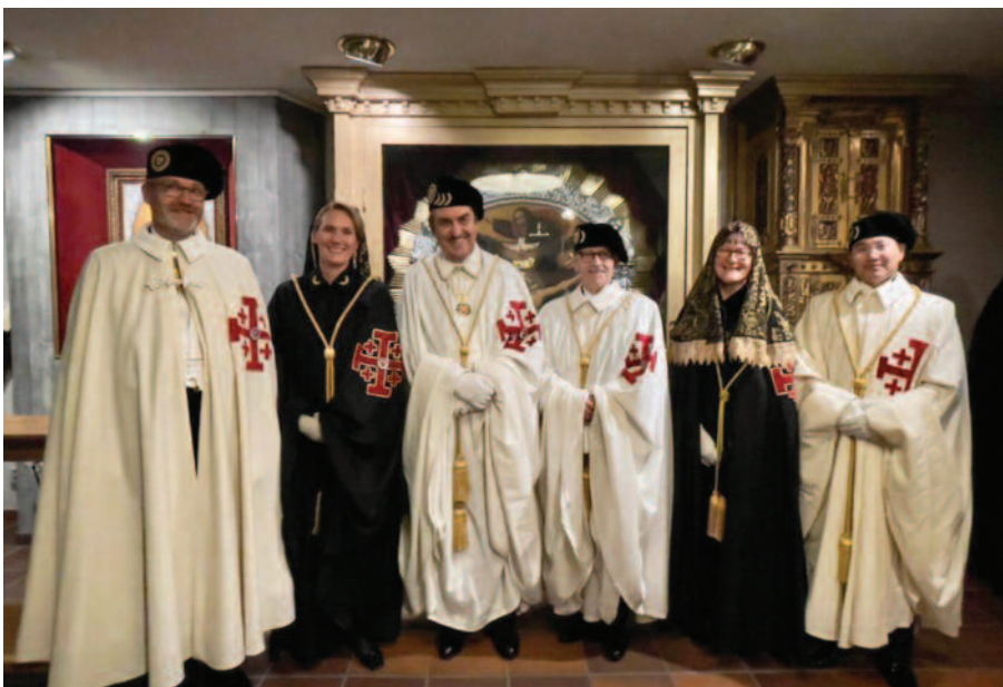
Rencontre des Lieutenants des pays de l'Europe du Nord à Stockholm, en Suède, autour du Gouverneur Général, l'Ambassadeur Leonardo Visconti di Modrone.

Quelques jours plus tard, d'autres Lieutenances se sont réunies à l'occasion des Investitures à Vienne les 23 et 24 septembre (avec la veillée de prière en la cathédrale Saint-Étienne le vendredi 23 septembre, et l'Investiture présidée par le Grand Prieur de la Lieutenance, l'abbé Raimund Schreier, le lendemain en l'église Saint-Augustin). Outre le Gouverneur Général, et le Vice-Gouverneur pour l'Europe Jean-Pierre de Glutz, les Lieutenants d'Autriche, de Belgique, d'Allemagne, d'Angleterre et du Pays de Galles, du Luxembourg, des Pays-Bas, de l'Espagne orientale, de Slovaquie, de Suisse et du