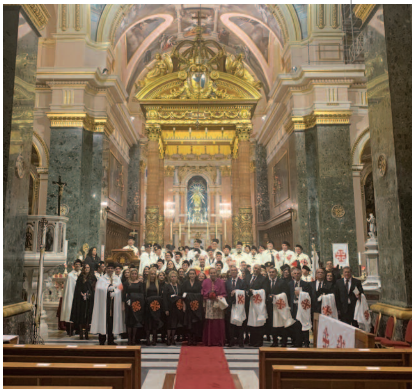
La veillée et la cérémonie d'Investiture de la Lieutenance maltaise se sont déroulées respectivement en la basilique collégiale de la Nativité de la Vierge à Senglea (notre photo) et à la cathédrale métropolitaine de Saint-Paul à Mdina.