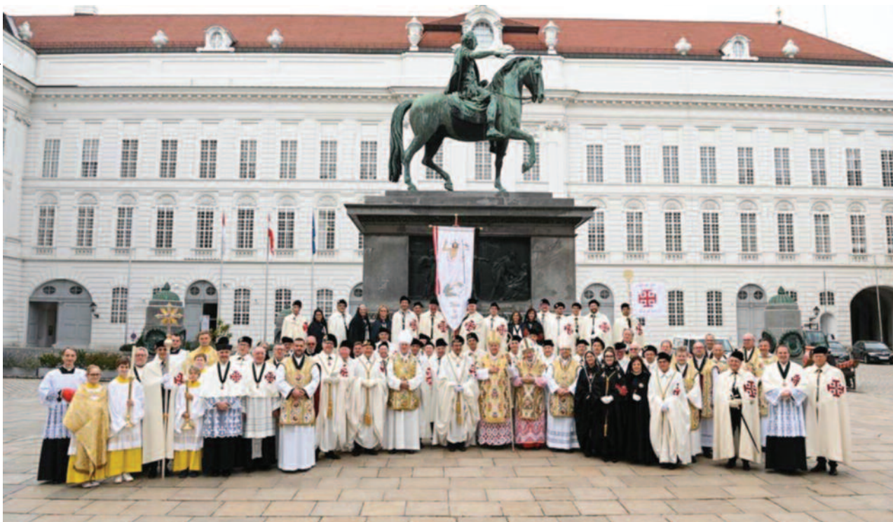
Plusieurs Lieutenances étaient représentées à l'occasion des Investitures à Vienne.

Liechtenstein étaient présents. Dans son discours aux nombreux participants lors du dîner de gala qui a suivi les Investitures à Vienne, le Gouverneur Général a exhorté les personnes présentes à renforcer l'unité de l'Ordre tout en respectant la diversité des traditions. Le nouveau Rituel, l'engagement pour une plus grande implication spirituelle, et la générosité envers l'Église Mère de Jérusalem doivent être partagés par toutes les