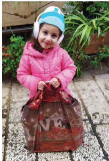
L'Ordre du Saint-Sépulcre participe aussi à l'achat de cadeaux offerts aux enfants de Terre Sainte dont les familles sont en difficulté.