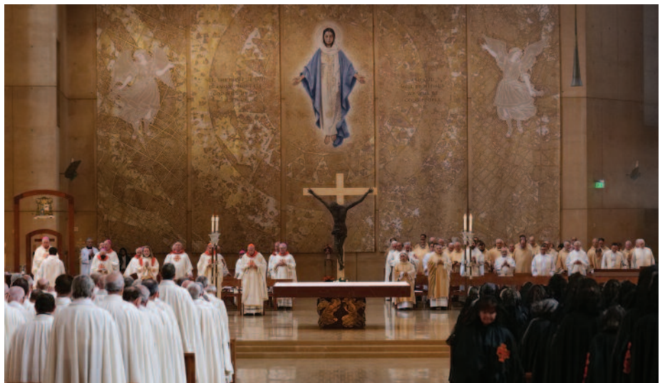
Célébration d'investiture dans l'église Notre-Dame des Anges à Los Angeles, en Californie.