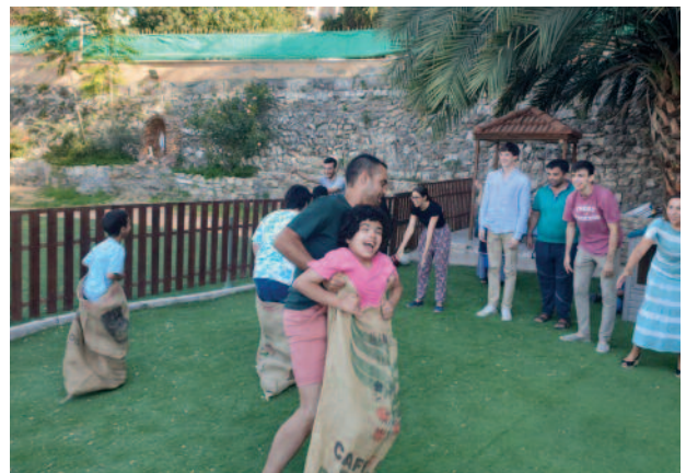
Les jeunes de la Lieutenance pour l'Espagne occidentale ont pu faire l'expérience de différents services en Terre Sainte, notamment auprès d'enfants ayant un handicap.

Les jeunes ont pu faire l'expérience de différents services, en plusieurs groupes : certains ont aidé les Sœurs du Verbe Incarné qui travaillent au Hogar Niño Dios (maison pour enfants porteurs de handicap), pour certains travaux de nettoyage et de préparation d'espaces pour accueillir, ainsi que dans une autre maison à Beit Sahour, où se trouvent des enfants plus âgés avec des handicaps pour lesquels il convient qu'ils disposent de leur propre environnement sans trop de contacts avec les enfants plus jeunes ac-