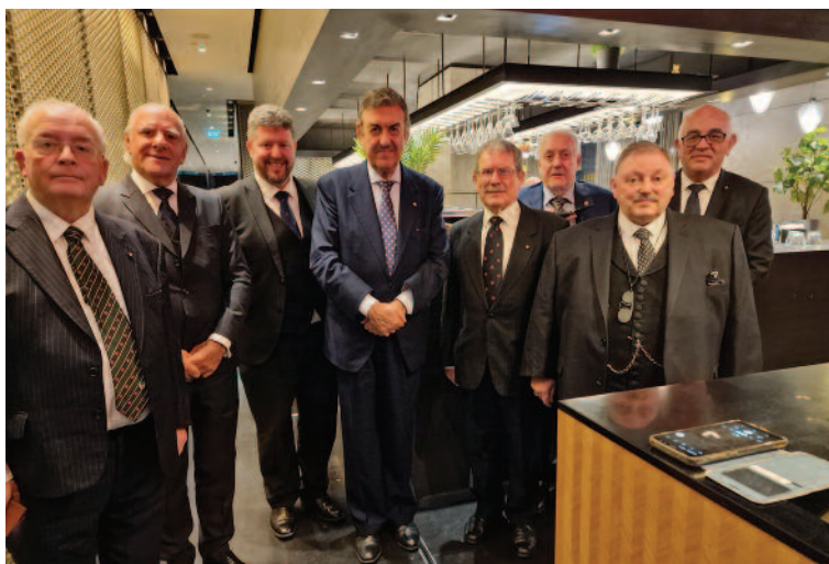
Les Lieutenants et les Délégués Magistraux de pays anglophones (Angleterre et Pays de Galles, Écosse, Irlande, Gibraltar et Afrique du Sud) ont rencontré le Gouverneur Général à Londres, en marge des cérémonies d'Investiture.