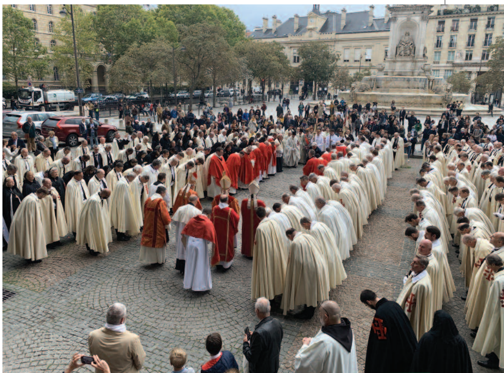
De nouveaux membres de la Lieutenance pour la France et de la Lieutenance pour le Luxembourg ont été investis dans l'église Saint-Sulpice, à Paris, en présence de nombreux Chevaliers et Dames.