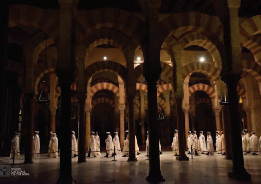
L'Investiture de la Lieutenance pour l'Espagne Occidentale a été célébrée dans la cathédrale de Cordoue.