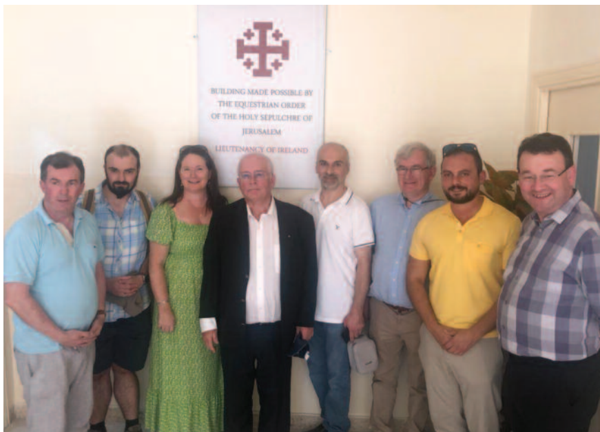
Le pèlerinage des Chevaliers et Dames irlandais comprenait la visite des paroisses de Taybeh en Palestine et de Mafraq en Jordanie, où la Lieutenance de l'Ordre pour l'Irlande a financé de petits projets, développant ainsi un lien d'amitié avec ces communautés.

À Taybeh, le dernier village entièrement chrétien de Palestine, nous avons visité la maison de retraite Beit Afram, gérée par les Sœurs du Verbe Incarné. Notre Lieutenance a fait don d'une somme importante pour financer les travaux de sécurité incendie ur-