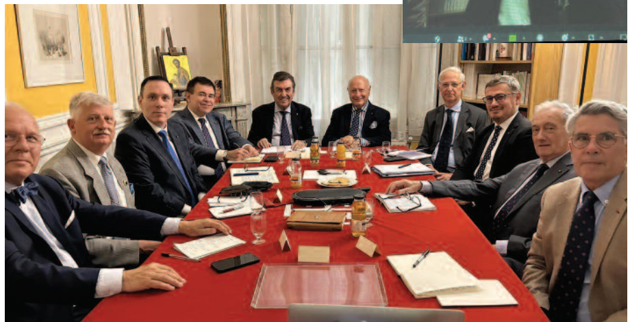
Le Gouverneur Général Leonardo Visconti di Modrone, entouré du Vice-Gouverneur pour l'Europe, Jean-Pierre de Glutz, et des Lieutenants francophones, à Paris, lors d'une rencontre de coordination.