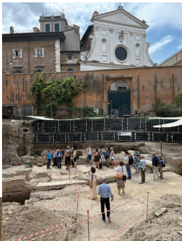
Conférence de presse au Palazzo della Rovere le 26 juillet 2023, présentant les récentes découvertes archéologiques.

compte de ces découvertes, présentant également à cette occasion la mission de l'Ordre du Saint-Sépulcre au service de la culture de la rencontre en Terre Sainte.