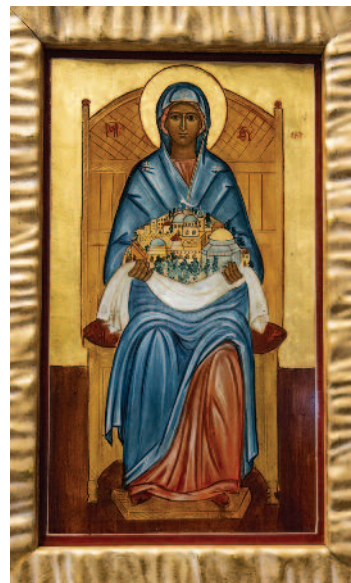
Une icône de Notre-Dame de Palestine, peinte par les Soeurs de Béthléem, montrant la Mère de Dieu portant sur son cœur la ville de Jérusalem et ses habitants de toute confession, symbole de l'humanité nouvelle.

« femme », qui souhaite apparaître et conclure sa relation temporelle pour la transmettre, à travers Jean (« Voici ta mère »), à la nouvelle famille qu'il est en train d'établir par sa mort et sa résurrection ; dès lors, Marie appartient à l'Église pour laquelle son Fils a donné sa vie en rançon. Cette pensée appartient à la spiritualité la plus profonde de l'Ordre, qui chérit les mêmes