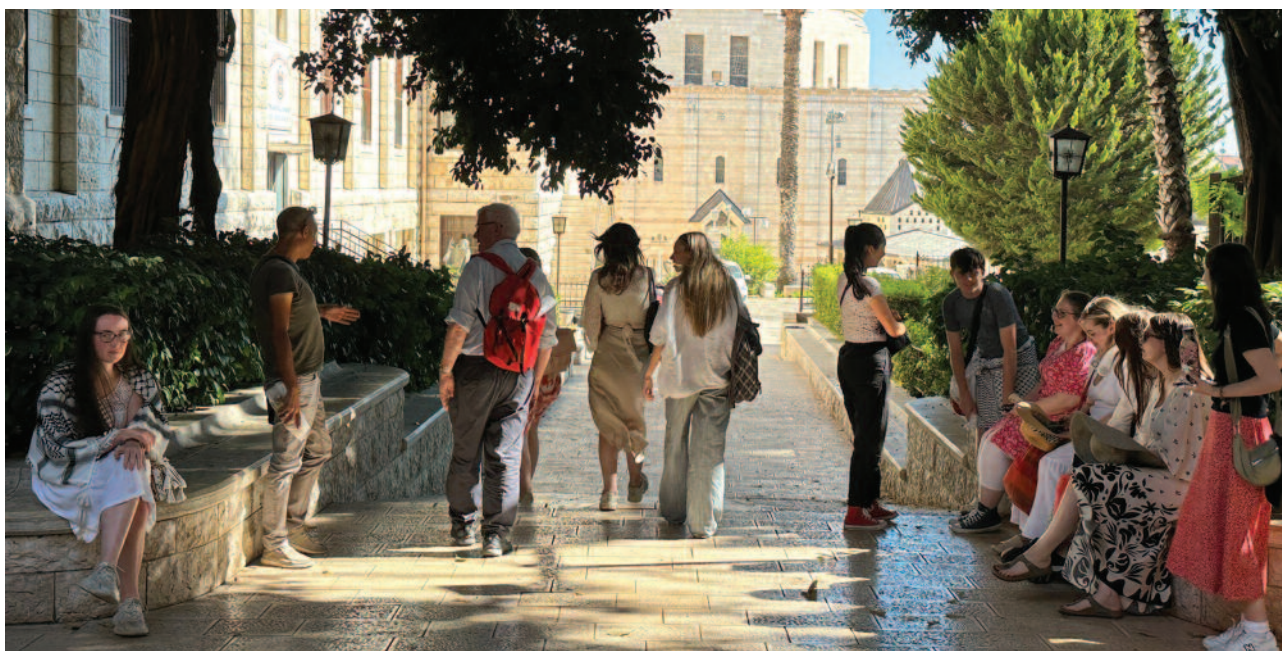
Les étudiants de Glasgow et ceux de l'université de Bethléem ont tissé des liens d'amitié qui sont porteurs d'espérance pour une collaboration future.

tout comme les opportunités d'interagir avec des personnes importantes dont les contributions généreuses ont laissé des impressions durables. Nous avons passé beaucoup de temps au Patriarcat latin à écouter et à discuter du rôle de l'Église catholique en Terre Sainte, en particulier en ce qui concerne l'aide humanitaire.