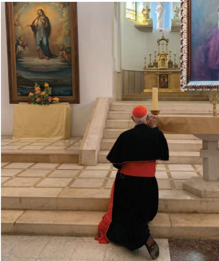
Le Patriarche Luigi Barlassina (représenté sur le tableau en haut à droite) fit ériger le sanctuaire de Deir Rafat, où le cardinal Fernando Filoni, Grand Maître, a souhaité se rendre en pèlerinage le 11 mai 2022 pour vénérer l'image de Notre-Dame de Palestine, Patronne de l'Ordre.

Le sanctuaire de Deir Rafat abrite la première image de Marie Reine de Palestine ; dans la partie inférieure de l'image, on reconnaît les contours de la Ville Sainte et de Jéricho, deux villes symboles. Outre cette image historique, l'Ordre Équestre du Saint-Sépulcre chérit, pour son expressivité, une autre image de Marie, également appelée Reine de Palestine, sur laquelle Marie apparaît assise sur un trône, tenant sur ses genoux une maquette de la cité de Jérusalem, symbole de la Terre sainte, mais aussi symbole de l'Église, la nouvelle Ville Sainte de l'Apocalypse (Ap 21,2) qui,