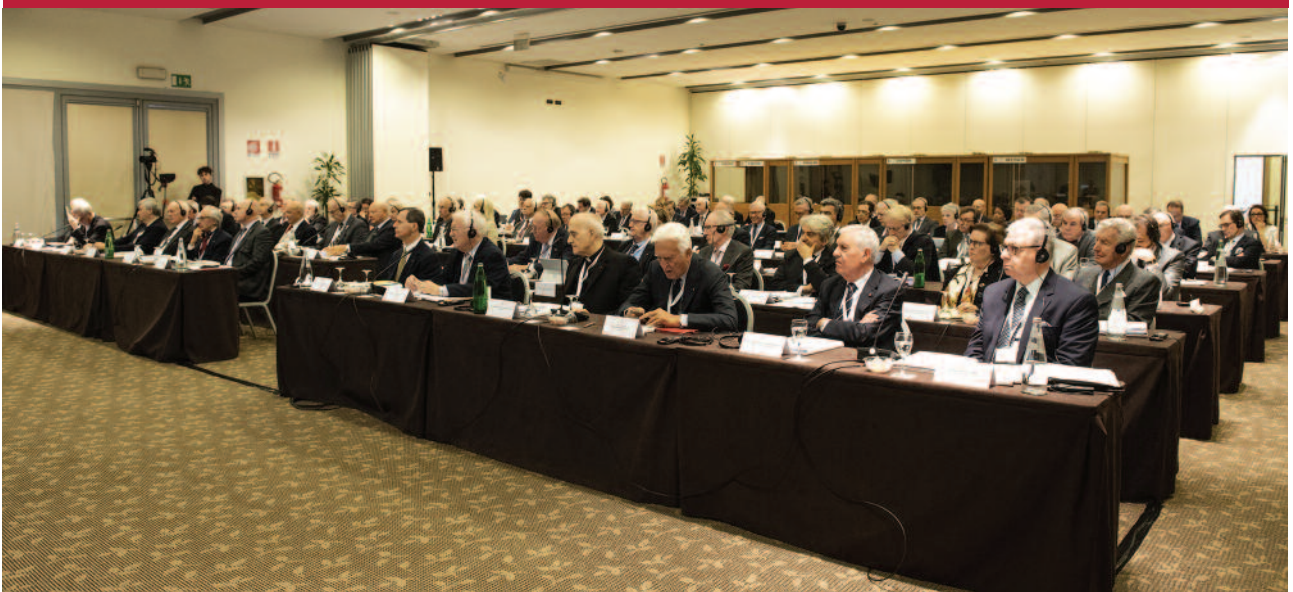
Les participants de la Consulta de l'Ordre en 2018, lors d'une séance de travail.

La Consulta est le principal organe consultatif du Grand Maître dans l'esprit synodal et, comme nous pouvons le lire dans les Statuts, ce « n'est pas un organe délibératif, mais ses propositions s'insèrent dans le processus décisionnel relatif aux questions les plus importantes concernant l'Ordre » (Art. 17.1). À l'issue de cette rencontre et de