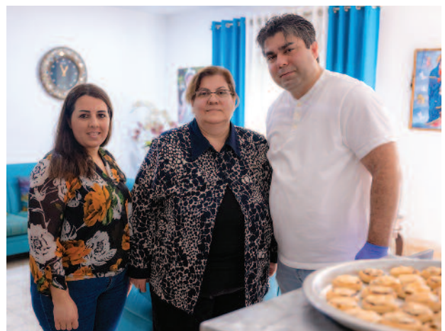
Une famille de Terre Sainte a été soutenue pour sa petite entreprise qui produit des pâtisseries à son domicile, grâce au projet AFAQ.

pour entrer sur le marché du travail ; les assistants sociaux de 17 écoles ont été formés à l'orientation professionnelle afin de mieux servir leurs élèves et de les aider à découvrir leurs aptitudes et les possibilités de carrière et d'études qui s'offrent à eux ; 19 start-ups ont été soutenues grâce à une contribution de 3 000 dollars pour chacune ; 29 petites entreprises existantes ont reçu une subvention de 2 000 dollars pour améliorer leur activité et augmenter leurs revenus ; 47 diplômés sans emploi ont eu la possibilité d'effectuer un stage d'une durée de 3 à 6 mois destiné à les aider à entrer dans le monde du travail. À la fin du projet, plus de 40% d'entre eux ont obtenu un contrat de travail à durée indéterminée, sortant par là-même de leur condition de sans emploi ; 63 jeunes et femmes ont bénéficié d'une bourse d'études pour acquérir une expérience pratique dans