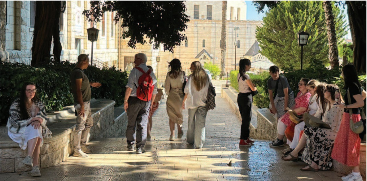
Die Studenten aus Glasgow und die Studenten der Universität Bethlehem haben freundschaftliche Bande geknüpft, die Hoffnung auf eine zukünftige Zusammenarbeit geben.

fahrt, ebenso wie die Gelegenheiten, mit bedeutenden Menschen zu kommunizieren, deren großzügige Beiträge bleibende Eindrücke hinterlassen haben. Wir verbrachten viel Zeit im Lateinischen Patriarchat, um zuzuhören und die Rolle der katholischen Kirche im Heiligen Land zu diskutieren, insbesondere im Hinblick auf die humanitäre Hilfe.“