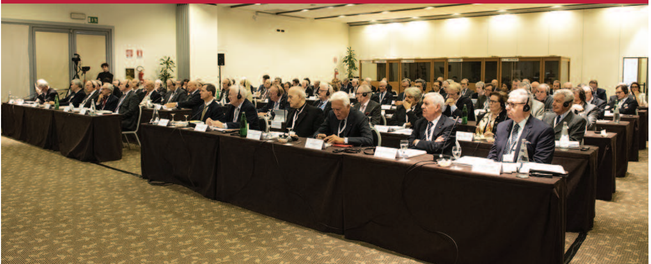
Die Teilnehmer an der Consulta des Ordens im Jahr 2018 bei einer Arbeitssitzung.

In einem synodalen Geist ist die Consulta das wichtigste Beratungsorgan des Großmeisters, und wie wir in der Satzung lesen können, „fasst sie keine Beschlüsse, doch fließen ihre Vorschläge in den Entscheidungsprozess hinsichtlich der wichtigsten den Orden be-