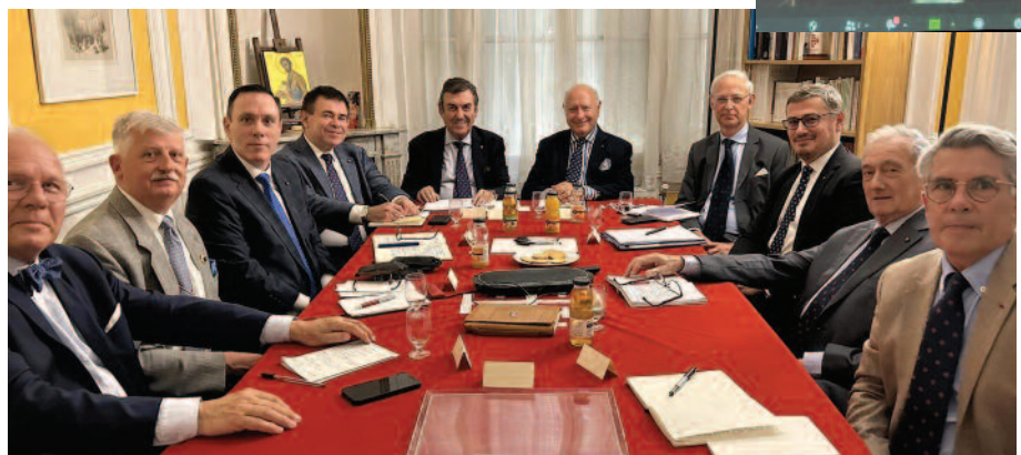
Generalgouverneur Leonardo Visconti di Modrone, umgeben vom Vizegouverneur für Europa, Jean-Pierre de Glutz und den französischsprachigen Statthaltern bei einem Koordinationstreffen in Paris.