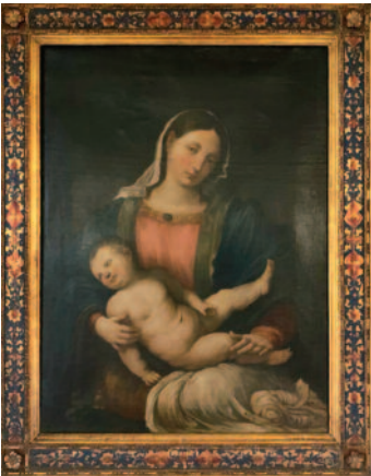
Ein Gemälde der Jungfrau Maria, die den Sohn Gottes in ihren Armen hält, schmückt den Thronsaal im Palazzo della Rovere, dem Sitz des Ordens in Rom.

Stadt Jerusalem, dem Symbol des Heiligen Landes, aber auch dem Symbol der Kirche, der neuen Heiligen Stadt aus der Geheimen Offenbarung (Offb 21,2), die sie wie eine wohlwollende Mutter beschützt und behütet. Ein altes Bild von Maria mit dem Kind auf ihrem Schoß wird ebenfalls im Ordenssitz aufbewahrt.