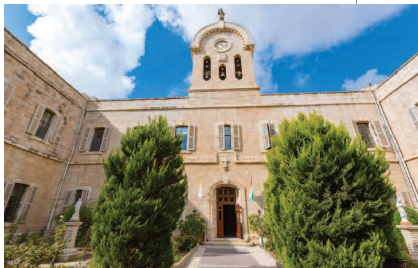
Die Universität von Bethlehem, die den Verbleib junger Palästinenser in ihrer Heimat fördert, wird seit vielen Jahren vom Orden unterstützt.

zum Schlechteren), über die er mit uns spricht: Die angespanntere Atmosphäre in Palästina in Bezug auf die in den Siedlungen lebenden Israelis und die zunehmende Angst der Studenten, bestimmte Spannungsgebiete zu durchqueren, so dass sie auf den Besuch von Vorlesungen an der Universität verzichten; die wachsende antichristliche Stimmung in Jerusalem; die stetige Reduzierung der Beiträge, die das Ministerium für höhere Bildung der Palästinensischen Nationalen palästinensischen Behörde an die Universität Bethlehem zahlt, die schließlich gegen Null geht (was das finanzielle Überleben der Universität, insbesondere in Zeiten von COVID gefährdet hat); aber auch mehr Freiheit bei der Interaktion zwischen Studenten und Studentinnen auf dem Campus, mehr Zugang zum Internet,