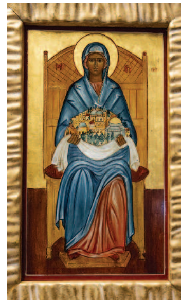
Eine Ikone Unserer Lieben Frau von Palästina, die von den Schwestern von Bethlehem gemalt wurde, zeigt die Mutter Gottes, die die Stadt Jerusalem und ihre Bewohner aller Konfessionen als Symbol der neuen Menschheit auf ihrem Herzen trägt.

Für die Ritter vom Heiligen Grab gehört Maria aus verschiedenen Gründen zum Orden. Ich möchte nur zwei davon erwähnen, die spirituell tiefgründig sind: Der erste ist, dass Maria im öffentlichen Leben Jesu kaum in Erscheinung tritt.