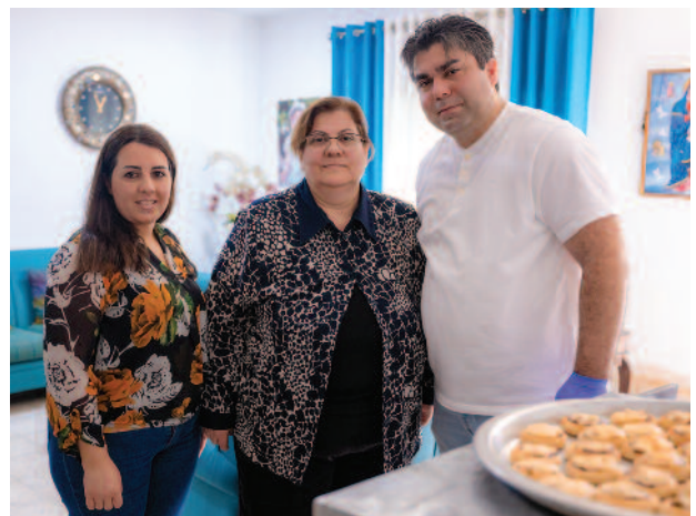
Eine Familie im Heiligen Land erhielt eine Unterstützung für ihr kleines Unternehmen, mit dem sie bei sich zu Hause Gebäck herstellen.

Die Sozialarbeiter von 17 Schulen wurden in Berufsorientierung geschult, damit sie ihren Schülern besser dienen und ihnen helfen können, ihre Fähigkeiten und die ihnen offenstehenden Berufs- und Studienmöglichkeiten zu entdecken. 19 Start-ups wurden mit einem Beitrag von jeweils 3.000 US-Dollar unterstützt. 29 bestehende Kleinunternehmen erhielten einen Zuschuss von 2.000 USD, um ihr Geschäft zu verbessern und ihr Einkommen zu steigern. 47 arbeitslose Hochschulabsolventen erhielten die Möglichkeit, ein dreis bis sechsmonatiges Praktikum zu absolvieren, das ihnen beim Einstieg in die Arbeitswelt helfen sollte. Am Ende des Projekts erhielten mehr als 40% von ihnen einen unbefristeten Arbeitsvertrag, wodurch sie ihre Situation als Arbeitslose hinter sich lassen konnten. 63 Jugendliche und Frauen erhielten ein Stipendi-