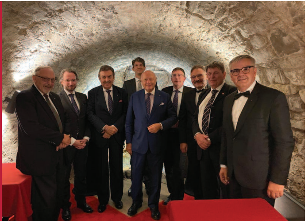
Treffen der Statthalter aus Mittel- und Osteuropa in Prag mit dem Generalgouverneur und dem Vizegouverneur für Europa.

Das Treffen in Prag ermöglichte den Teilnehmern, einen Überblick über die jüngsten Entwicklungen der Aktivitäten des Großmagi-