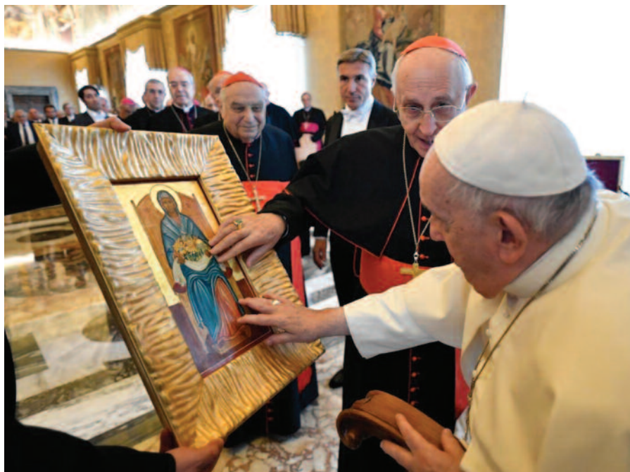
Die Ikone Unserer Lieben Frau von Palästina, der Patronin des Ordens, wurde vom Heiligen Vater am 9. November bei einer Audienz für die Teilnehmer an der Consulta gesegnet.

Die Ritter und Damen, die den Inhalt dieses Newsletters lesen, werden viele Aspekte erfassen, die ihnen helfen zu verstehen, dass der Or-