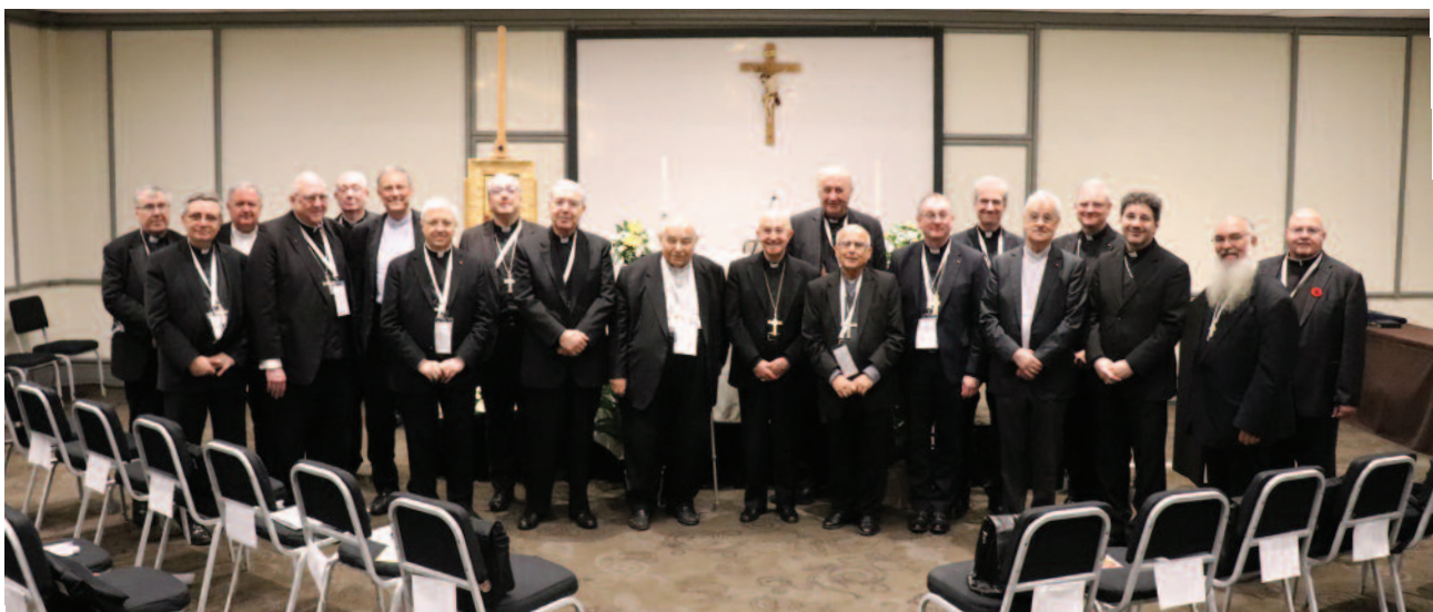
Kardinal Fernando Filoni und Erzbischof Tommaso Caputo umgeben von den Großprioren des Ordens, die an der Consulta teilnahmen.