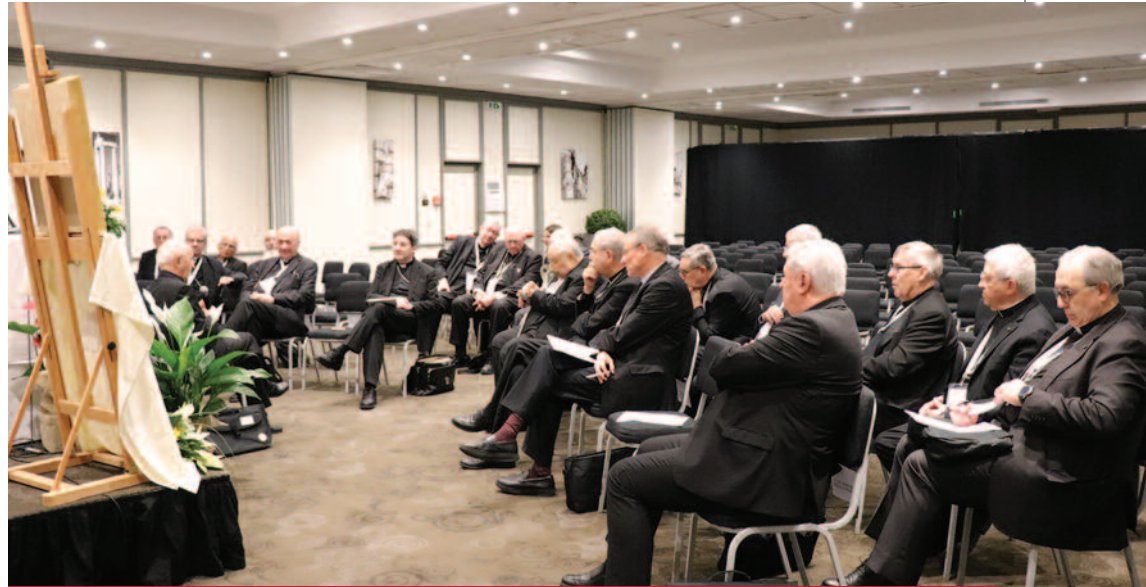
Die Großpriore, die an der Consulta teilnahmen, unterhielten sich mit dem Großmeister über das geistliche Leben der Ordensmitglieder.

Zeit der Begegnung und des Austauschs ein. „Als Großpriore ersetzen wir die Laien nicht, aber wir begleiten sie in ihrem Dienst, und das ist sehr wichtig. Die Statthalter und die Magistraldelegierten machen ihre Arbeit gut