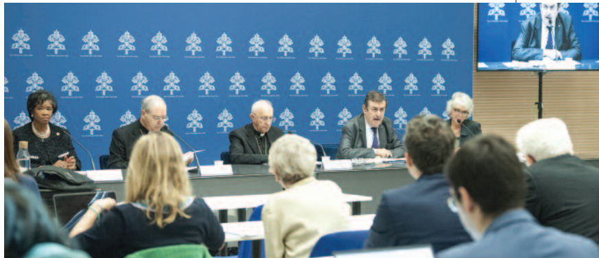
Zahlreiche Journalisten waren bei der Pressekonferenz zur Vorstellung der Consulta anwesend, die am 31. Oktober im Pressesaal des Heiligen Stuhls stattfand.

In Bezug auf das Engagement der Mitglieder des Ordens, die überwiegend Laien sind,