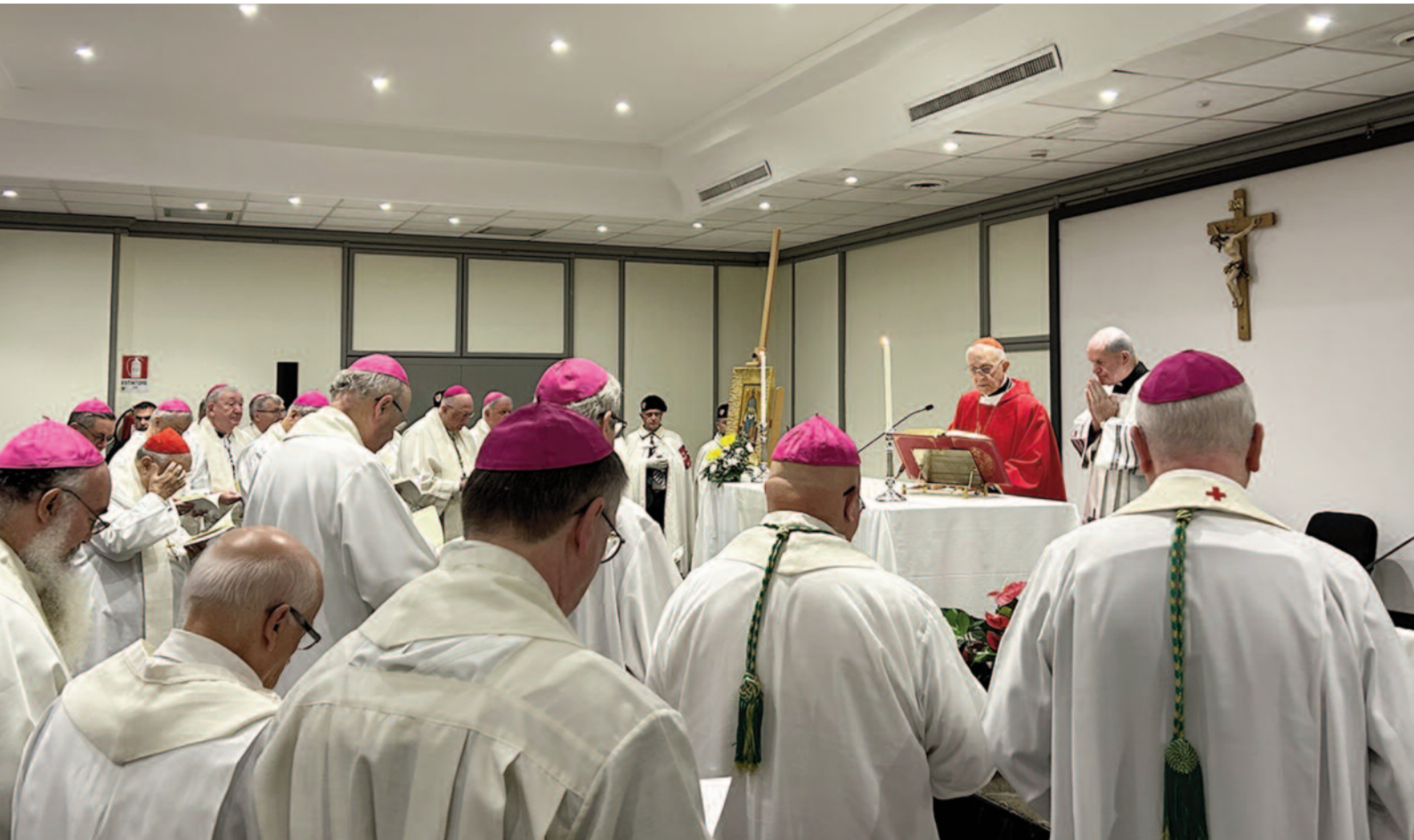
Messa del mattino presieduta dal Gran Maestro e concelebrata dai Gran Priori presenti alla Consulta dell'Ordine, nel novembre 2023.

È poi compito specifico del Luogotenente, quale Moderatore della procedura di ammissione degli ecclesiastici all'Ordine, di essere in sintonia con l'Eminentissimo/Eccellentissimo Gran Priore e i Priori locali, facendo sì che il loro numero e presenza risponda alle esigenze della Luogotenenza. Gli ecclesiastici, infatti, svolgono una vera missione pastorale affinché i Cavalieri e le Dame crescano nella fede e nel servizio alle proprie Chiese Locali insieme all'amore per la Terra Santa.