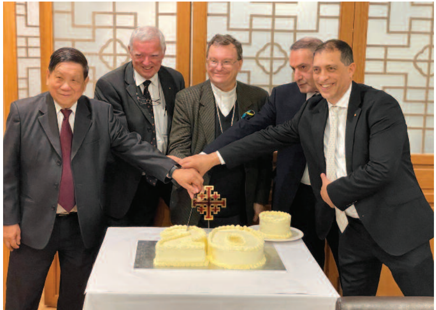
La torta per il 20° anniversario della Luogotenenza per il South Australia.