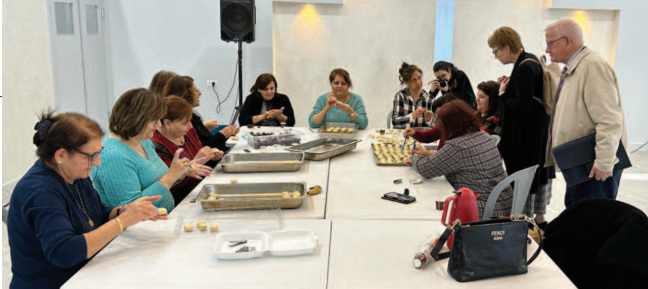
Le condizioni economiche della regione sono molto difficili, perciò alcune donne della parrocchia di Beit Sahour producono, confezionano e vendono dolci tradizionali, il cui ricavato viene donato alla scuola locale per sostenere le spese scolastiche.