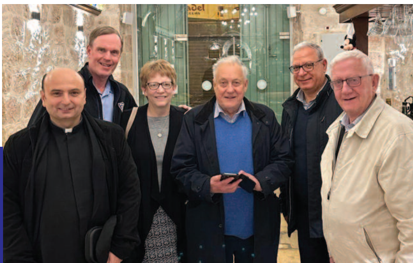
I membri della Commissione per la Terra Santa a Gerusalemme, accompagnati dall'Amministratore Generale del Patriarcato Latino, dal parroco di Gaza e dal Luogotenente per l'Inghilterra e il Galles, hanno partecipato alla visita.

La visita è iniziata presso diverse case cri-